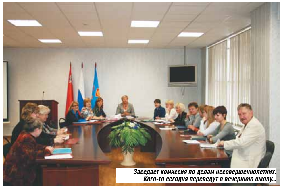
Заседает комиссия по делам несовершеннолетних. Кого-то сегодня переведут в вечернюю школу...

- Рабочий день школьника – за партой, а преждевременный переход на «взрослый» режим жизни может отрицательно сказаться на здоровье. И потом, чтобы дальше учиться в ВУЗе, вам же все равно придется на общих