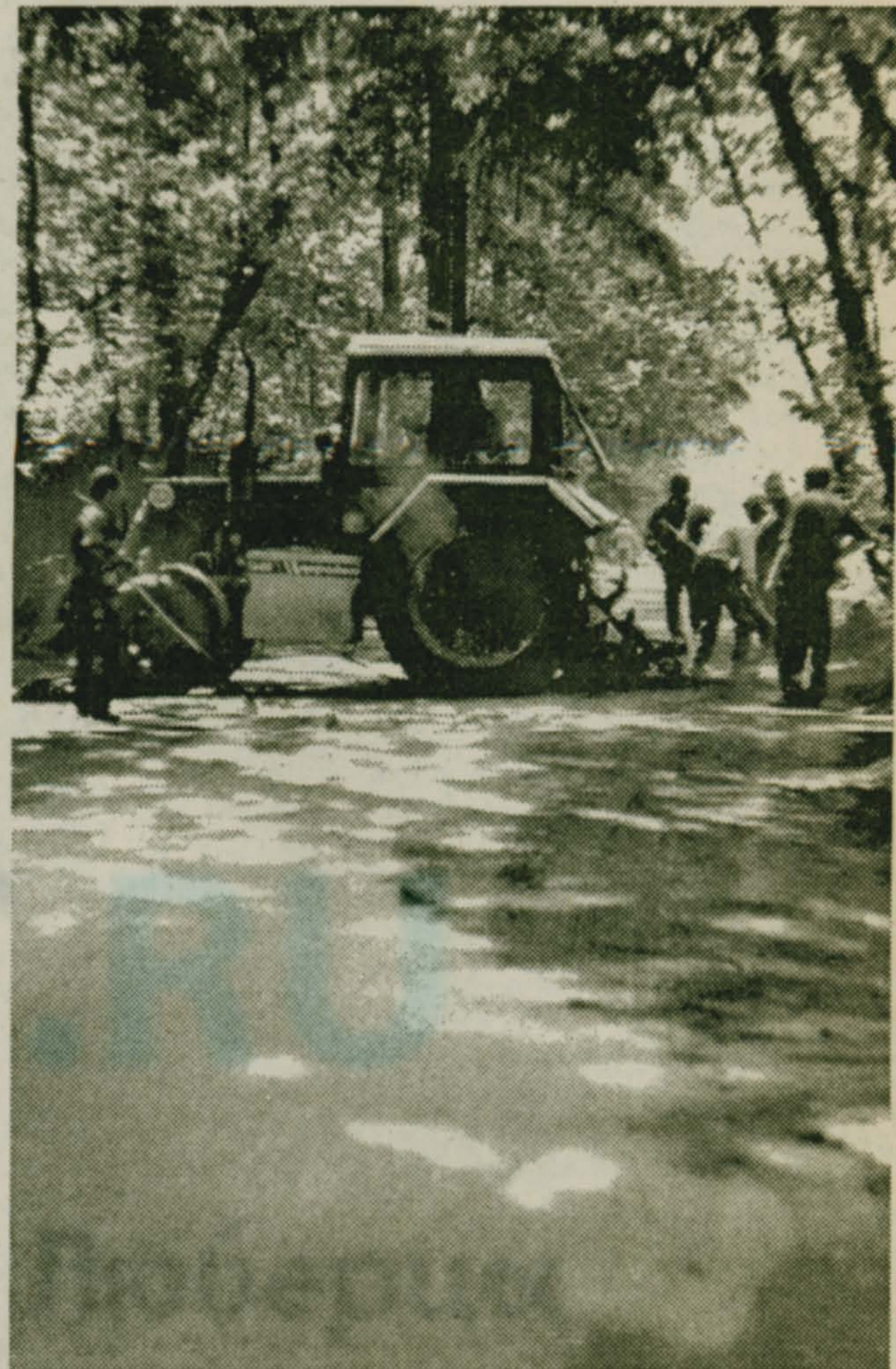
По просьбе администрации поселка фирма "Багдасаров" ведет капитальный ремонт шоссе, ведущего к Электропоселку. Все работы выполняет бригада дорожных строителей под руководством З.Н. Ованяна.