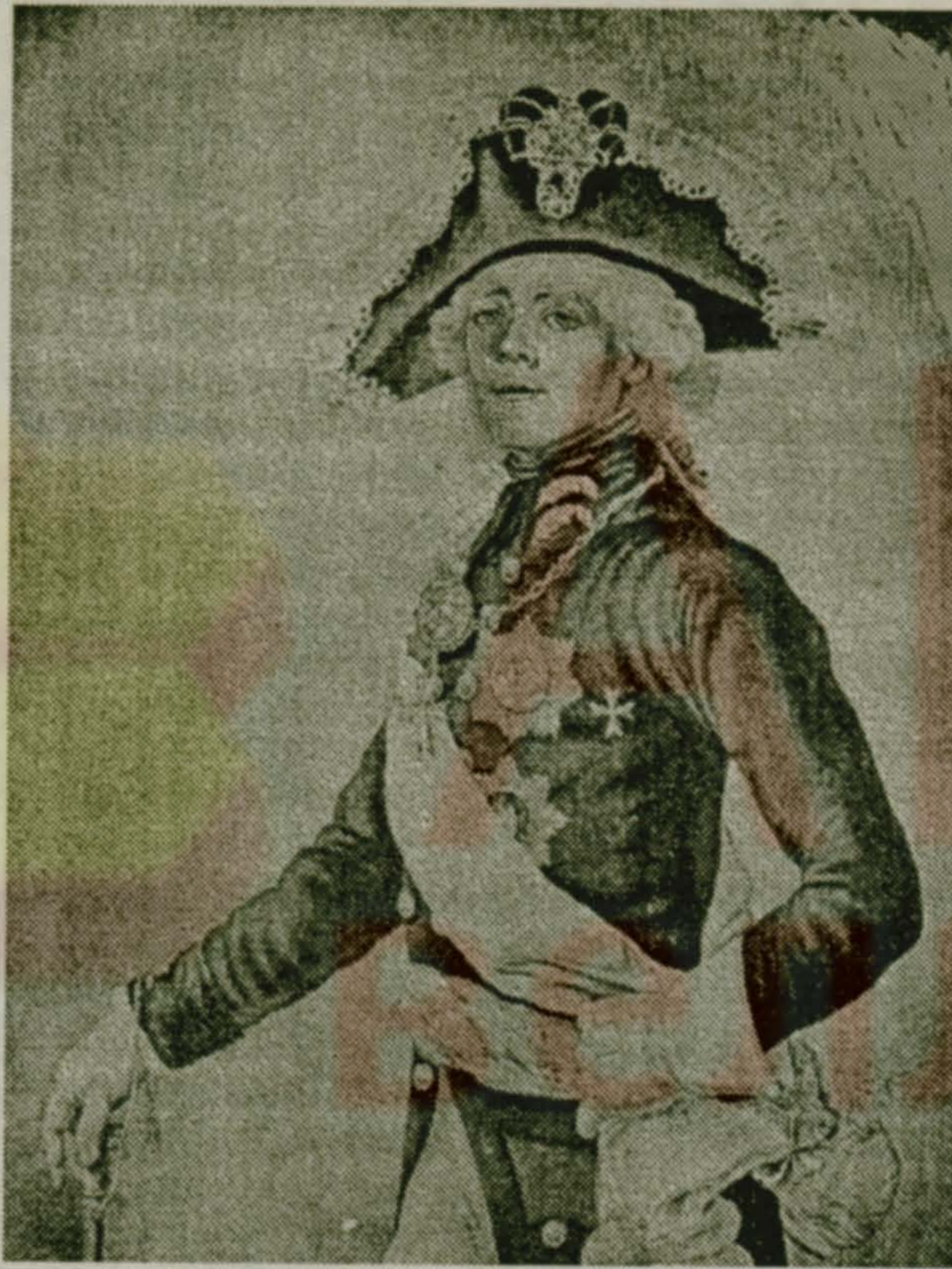
Император Павел I