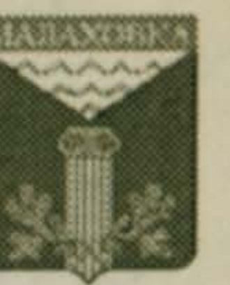
ГРАФИК ВЫВОЗА МУСОРА по уличным комитетам поселка Малаховка