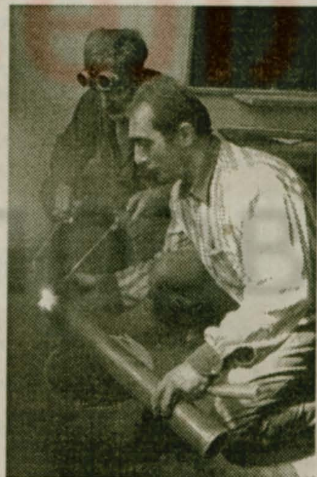
Капитальный ремонт отопительной системы в гимназии № 46

Резюме: Ходом подготовки школ и детских садов глава поселка вполне удовлетворен, но расслабляться нельзя, пока все необходимое не будет доведено до конца.