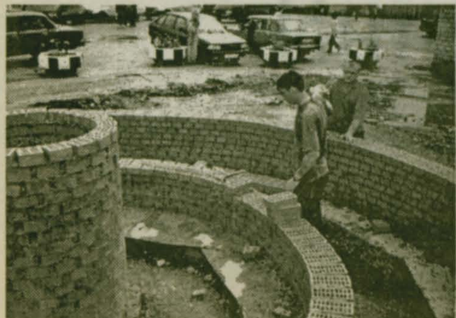
Июль 2000-го. Стройка в разгаре

В частности (забегая вперед), как возникли его предложения по формированию Совета и в чем принципиальное отличие существовавшего некогда Совета директо-