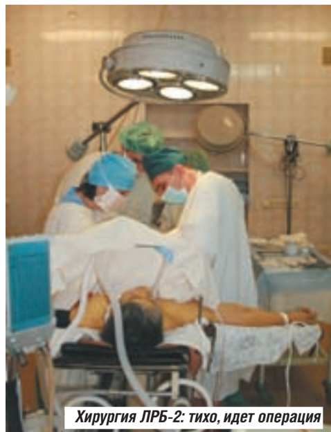
Хирургия ЛРБ-2: тихо, идет операция