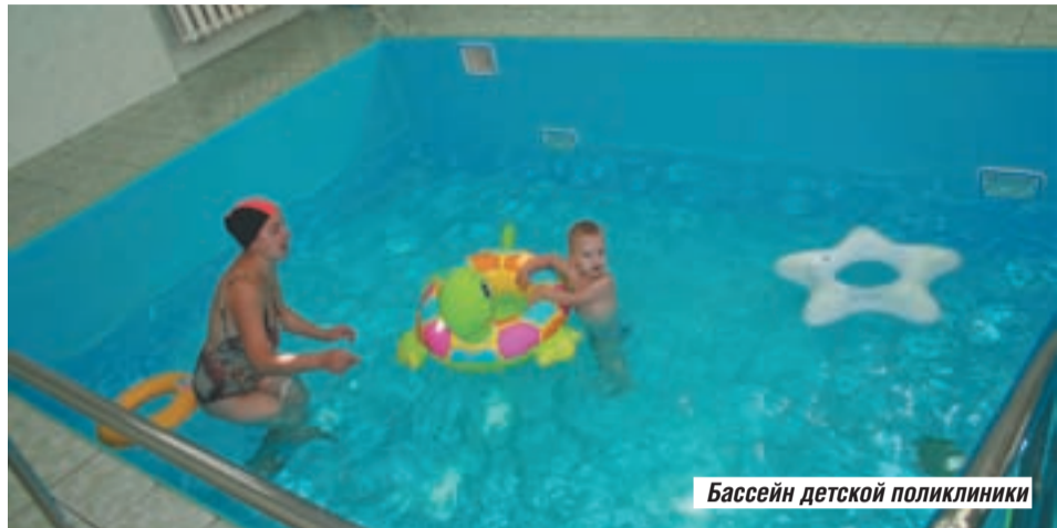
Бассейн детской поликлиники

16 сентября в детской больнице открылось еще одно уникальное отделение - неонатальной хирургии и реанимации. Здесь будут оперировать и выхаживать малышей с врожденными патологиями или травмами, а также появившихся на свет раньше срока. Пациентов ожидают со всей Московской области.