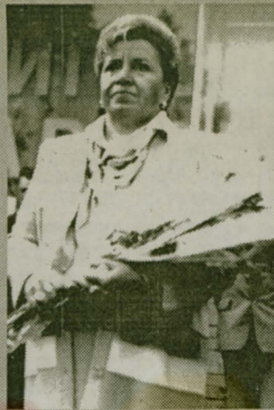
Герой дня в галстук

И не мудрено, что каждый чувствовал себя сегодня героем дня. А кое-кто и был им на самом деле.