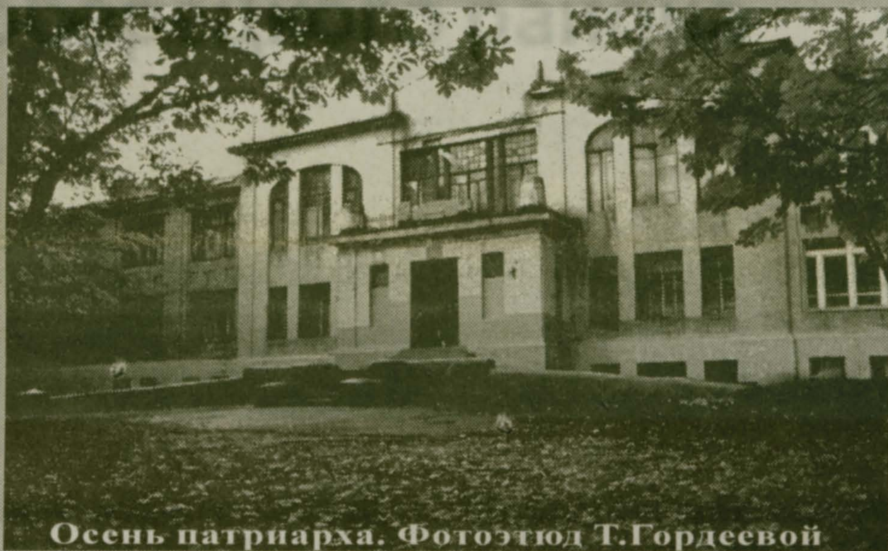
Осень патриарха.

Зданию первой в России сельской гимназии "совместного обучения детей обоего пола" этой осенью — 90 лет. Оно приняло первых гимназистов через два года после официального открытия гимназии. Два года занимались учащиеся в частных домах, на арендуемых территориях. А в это время быстро подвозились строительные материалы и строилось здание нашей Школы над оврагом.