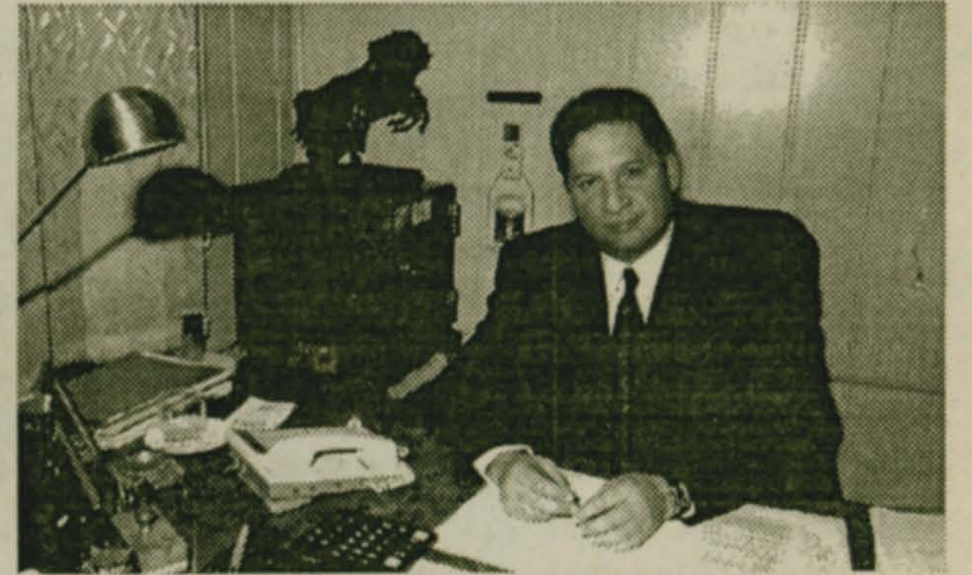
Людам нужны – реальные дела

Кандидат в депутаты Совета депутатов Люберецкого района по одномандатному избирательному округу № 13