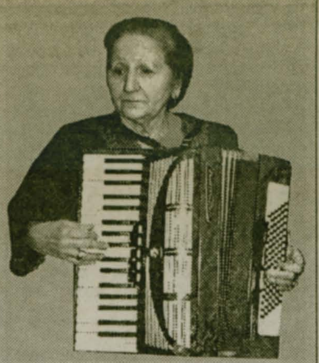
Читайте на стр. 3