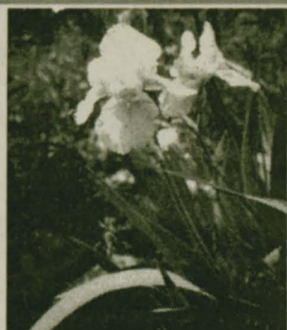
с 22 по 28 июня

Счастливым цветком июня названа роза. Счастливые камни месяца - жемчуг и лунный камень. Жемчуг, который, как считали древние греки - "затвердевшие слезы морских нимф". На Руси жемчугом украшали кокошники церковные облачения, короны и ордена. "В одной Троицкой лавре жемчугу больше, чем во всей Европе" - писал в XIX веке немецкий путешественник. Жемчуг бережет от дурного глаза, помогает предвидеть будущее. Страдающим малокровием давали пить молоко с толченым жемчугом. В России жемчуг добывали в северных реках, в озере Ильмень.