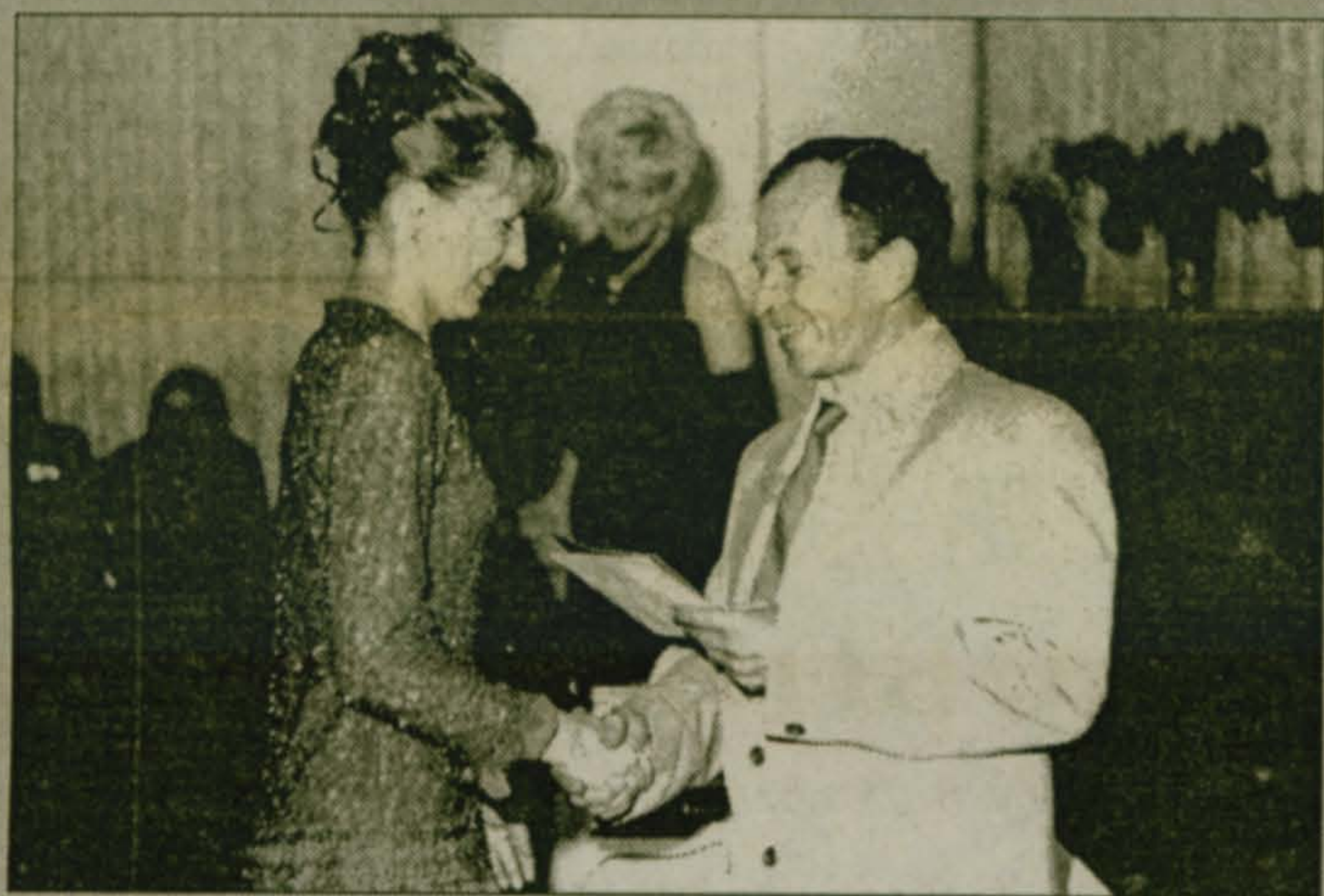
Фоторепортаж с выпускного вечера читайте на стр. 3