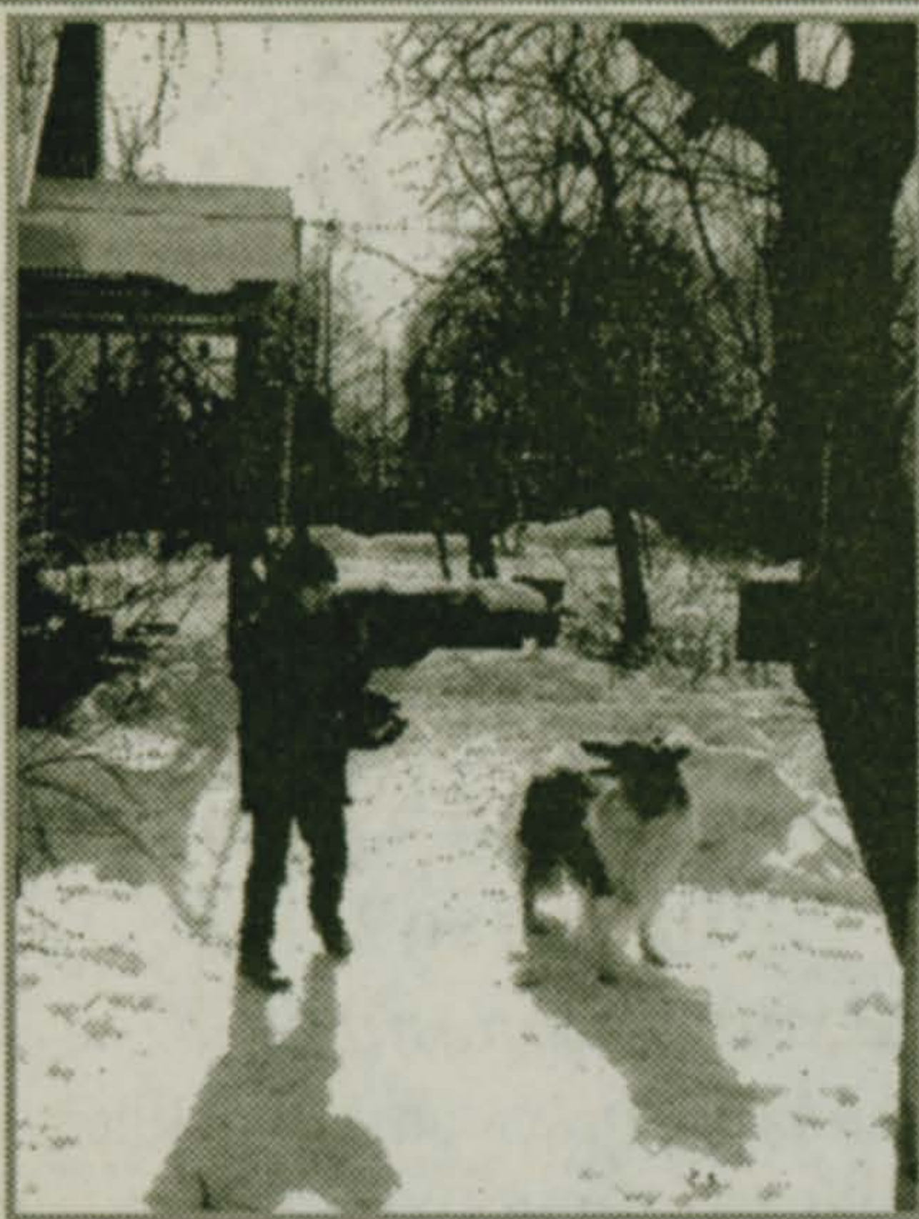
С 4 по 11 апреля

Среднемесячная температура апреля – плюс 3,7 градуса. Кроме талых вод выпадает 33 мм. Осадков. По календарю сбора лекарственных растений, в апреле заготавливают почки березы, чагу. Цветки бессмертника и ромашки, листья брусники, кору калины и крушины, плоды калины и корни одуванчика. 4 апреля. Василий Теплый. На Василия обычно солнце всегда ярко греть начинает, с крыш капель сыплет. Зяблики, чайки, березовый сок. «На Василия Тепло солнце в кругах – к урожаю».