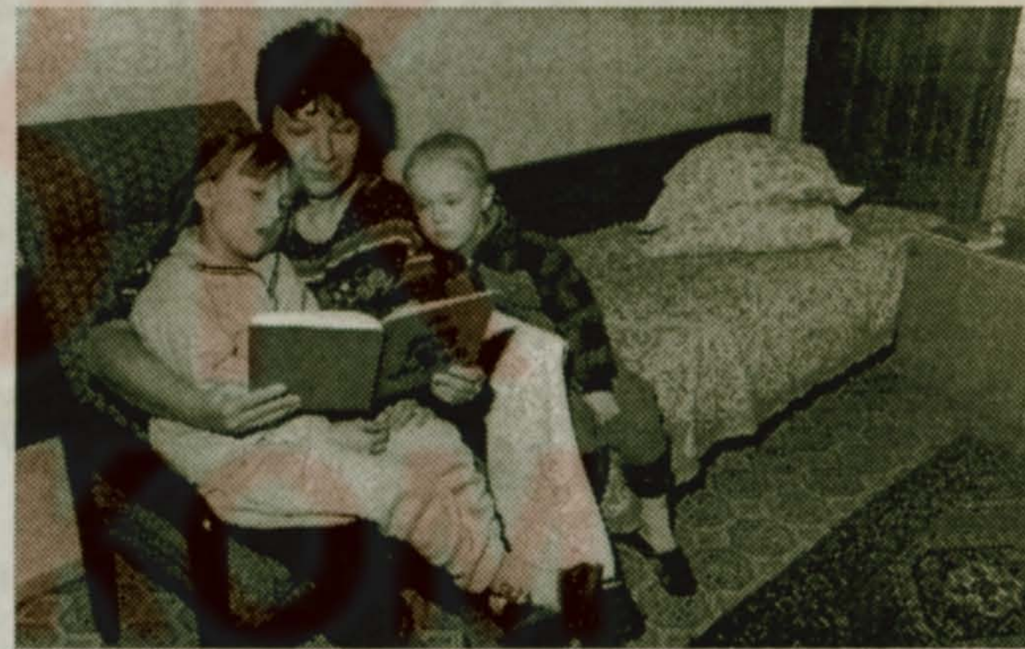
Номер в санатории, где живут дети со своими родителями