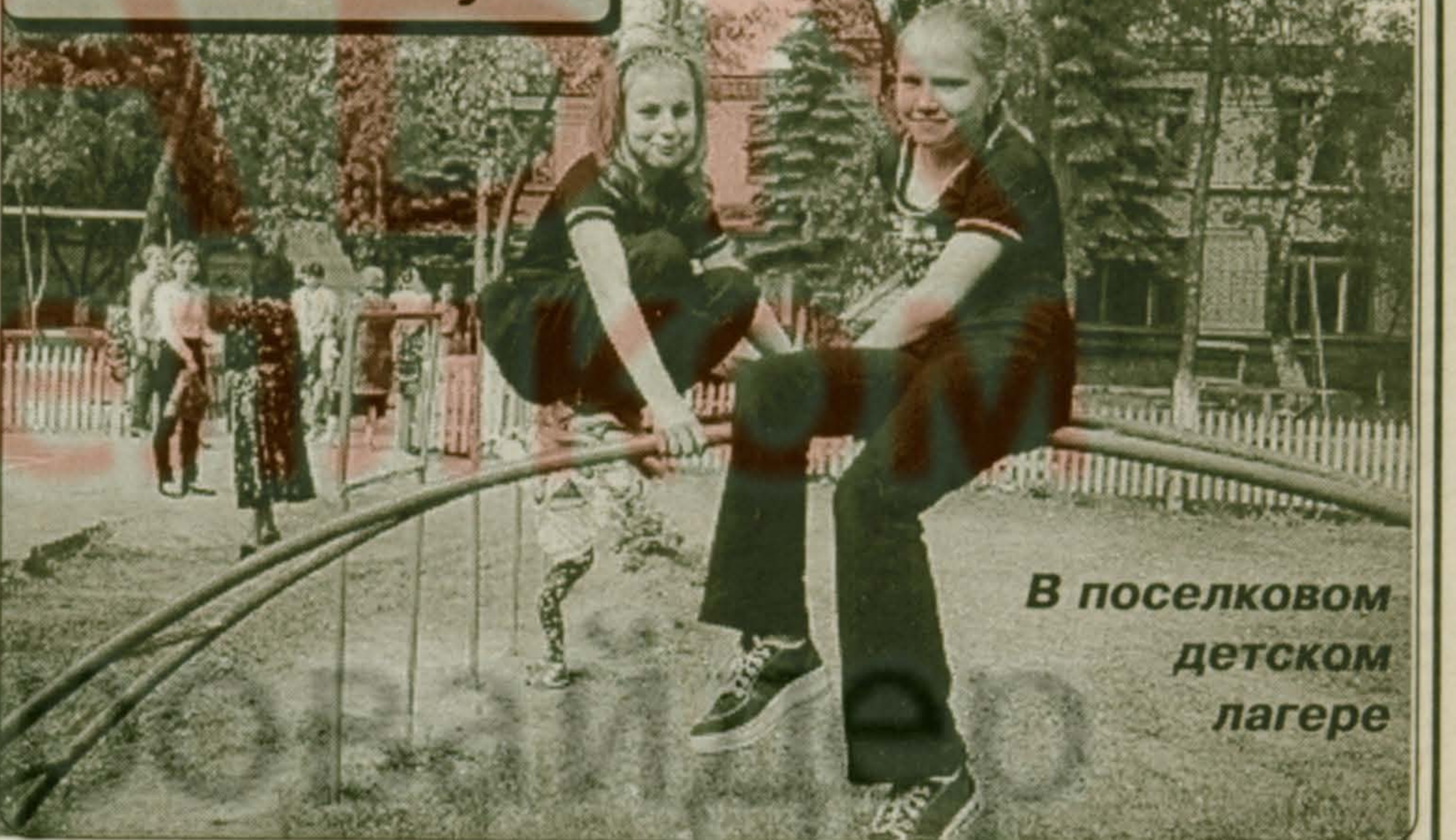
В поселковом детском лагере