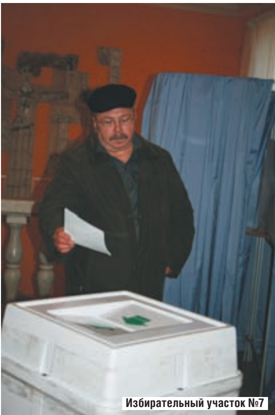
Избирательный участок №7