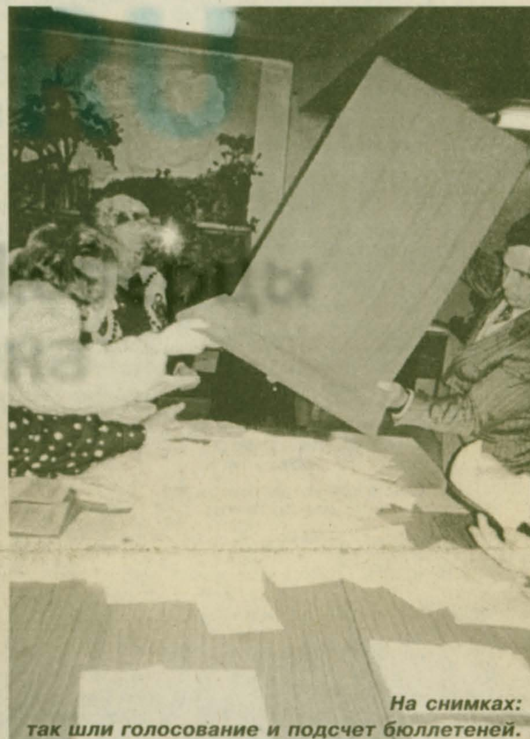
На снимках: так шли голосование и подсчет бюллетеней.