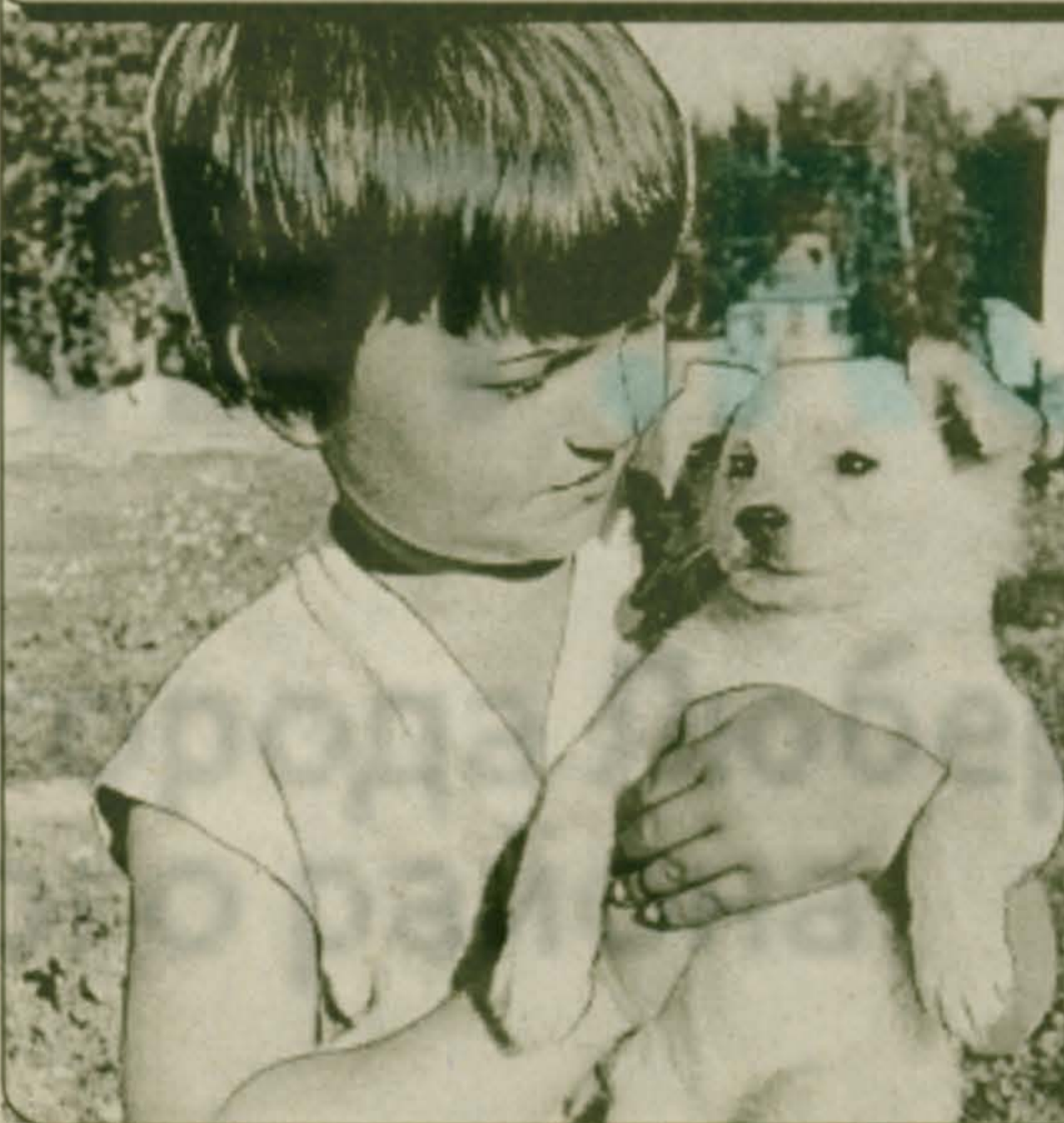
Неразлучные друзья.