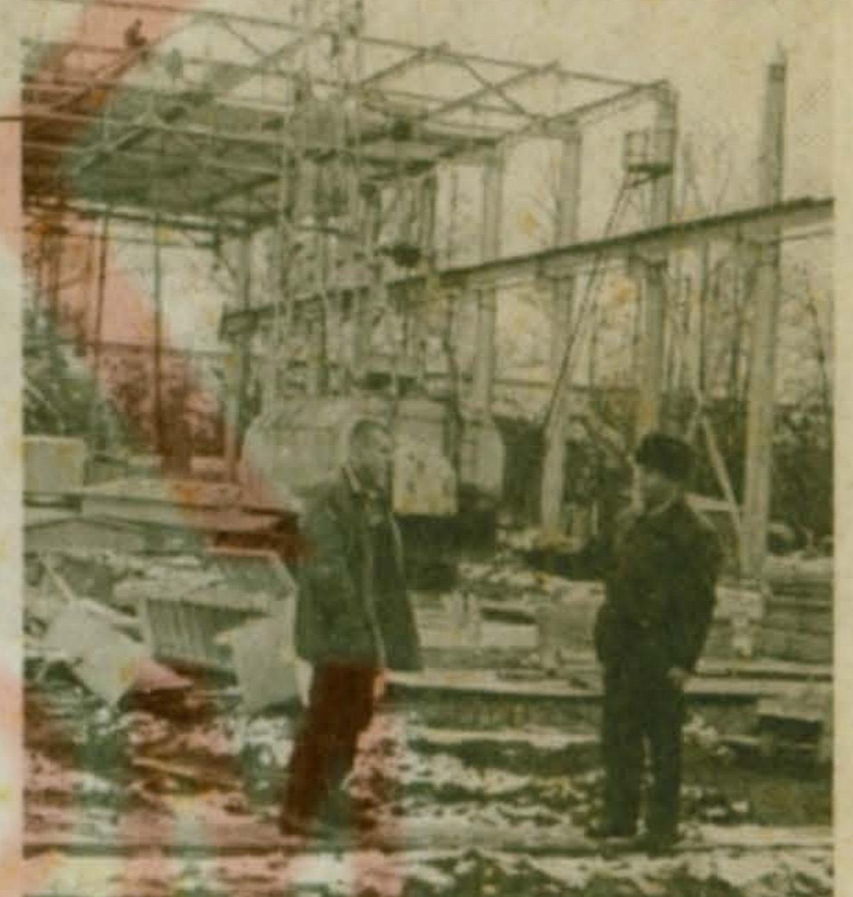
На снимках: так выглядит действующий корпус «Тензо-М»; а это - строится новый цех.