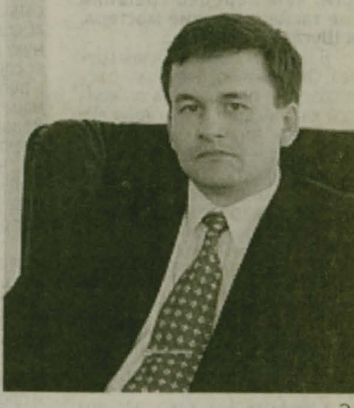
Глава Люберецкого района И.Ю. АКУРАТОВ

Дорогие люберчане! 11 апреля православные люди России и всего мира отметили праздник Светлого Христова Воскресения, или, как мы привыкли его называть, Пасху. Этот давний почитаемый всеми православными христианами народный обычай ежегодно достойно отмечается нами, как это делали наши деды и прадеды.