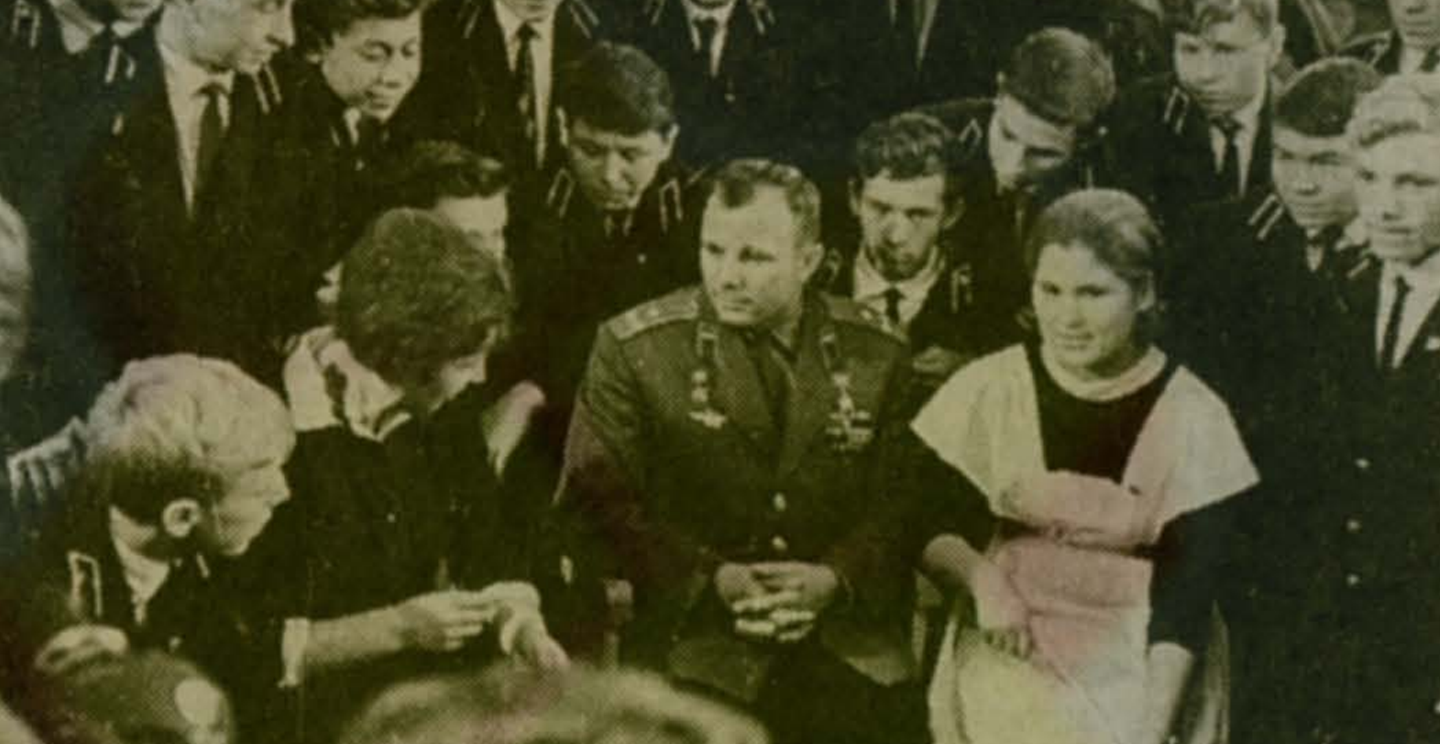
Наш корр. Фото Владимира Волкова

Отчет с праздника читайте в следующем номере.