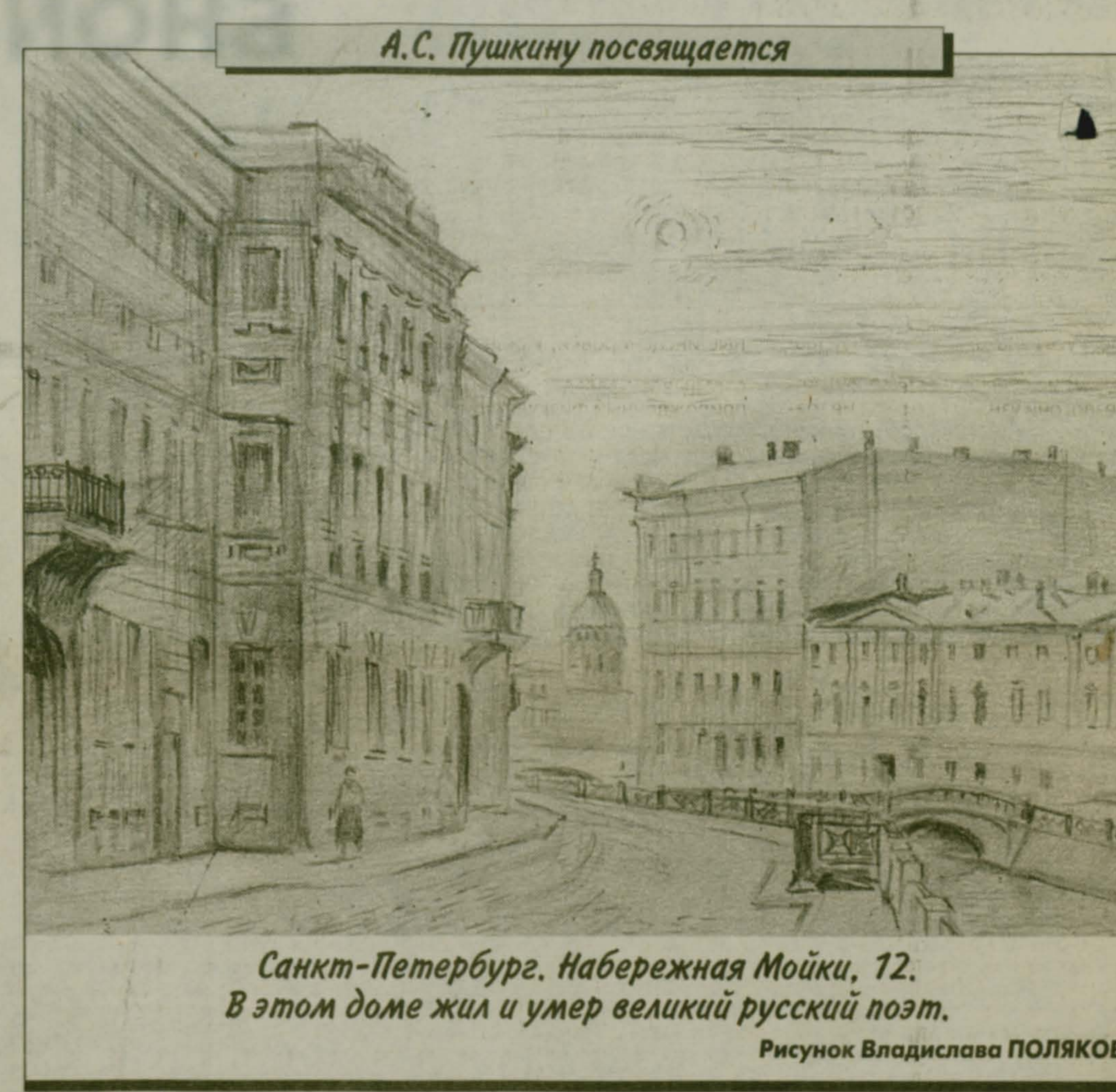
А.С. Пушкину посвящается. Санкт-Петербург. Набережная Мойки, 12. В этом доме жил и умер великий русский поэт. Рисунок Владислава ПОЛЯКОВА

Закон установлено, что сумма недополученных областными бюджетами доходов с учетом средств бюджетных фондов не может превышать 2% объема фактических доходов областного бюджета. В I квартале этого года этот показатель составил 4,9%, тогда как в прошлом году он равнялся 3,1%.