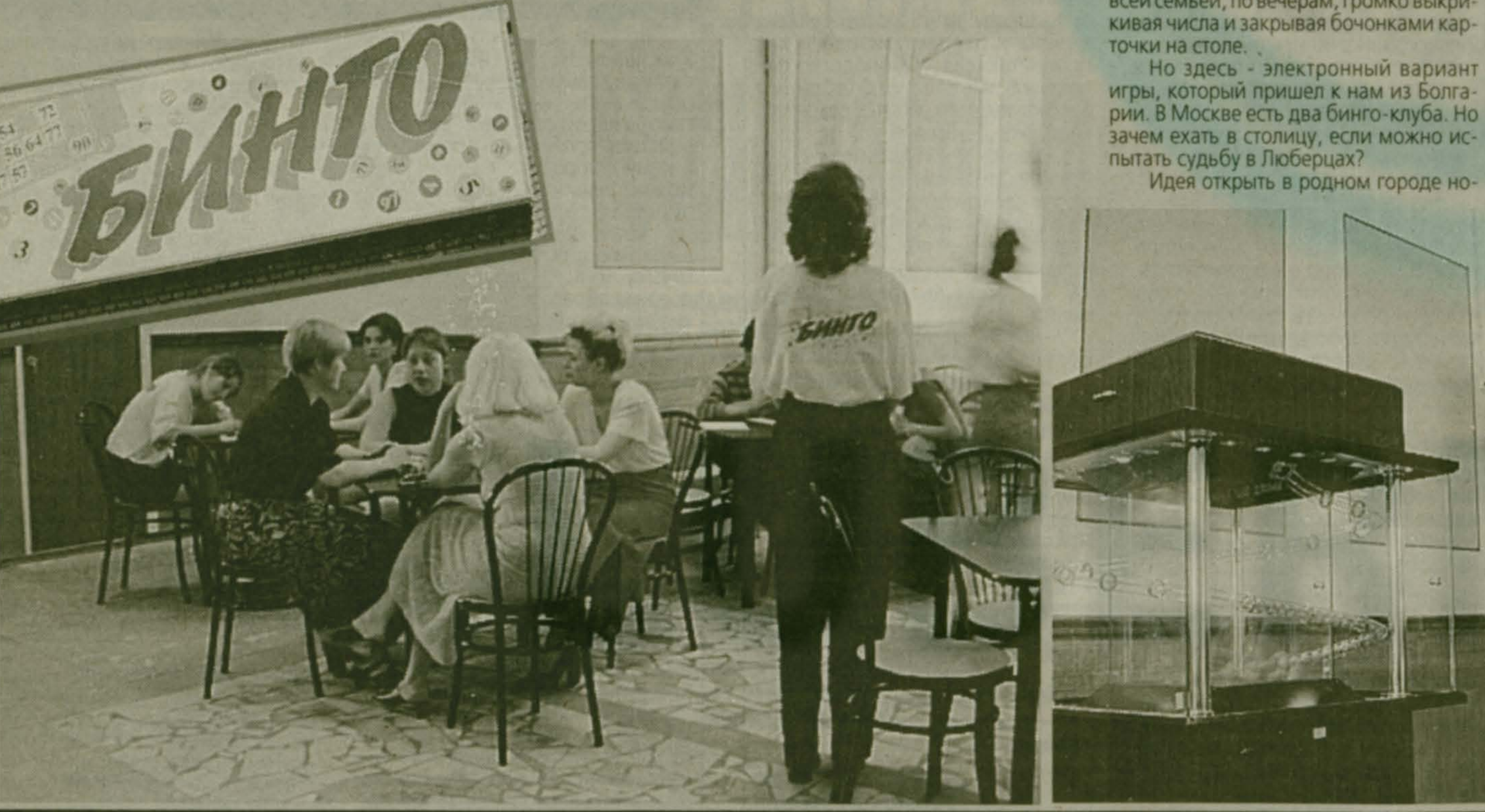
Играют в бинго в Луберецком клубе