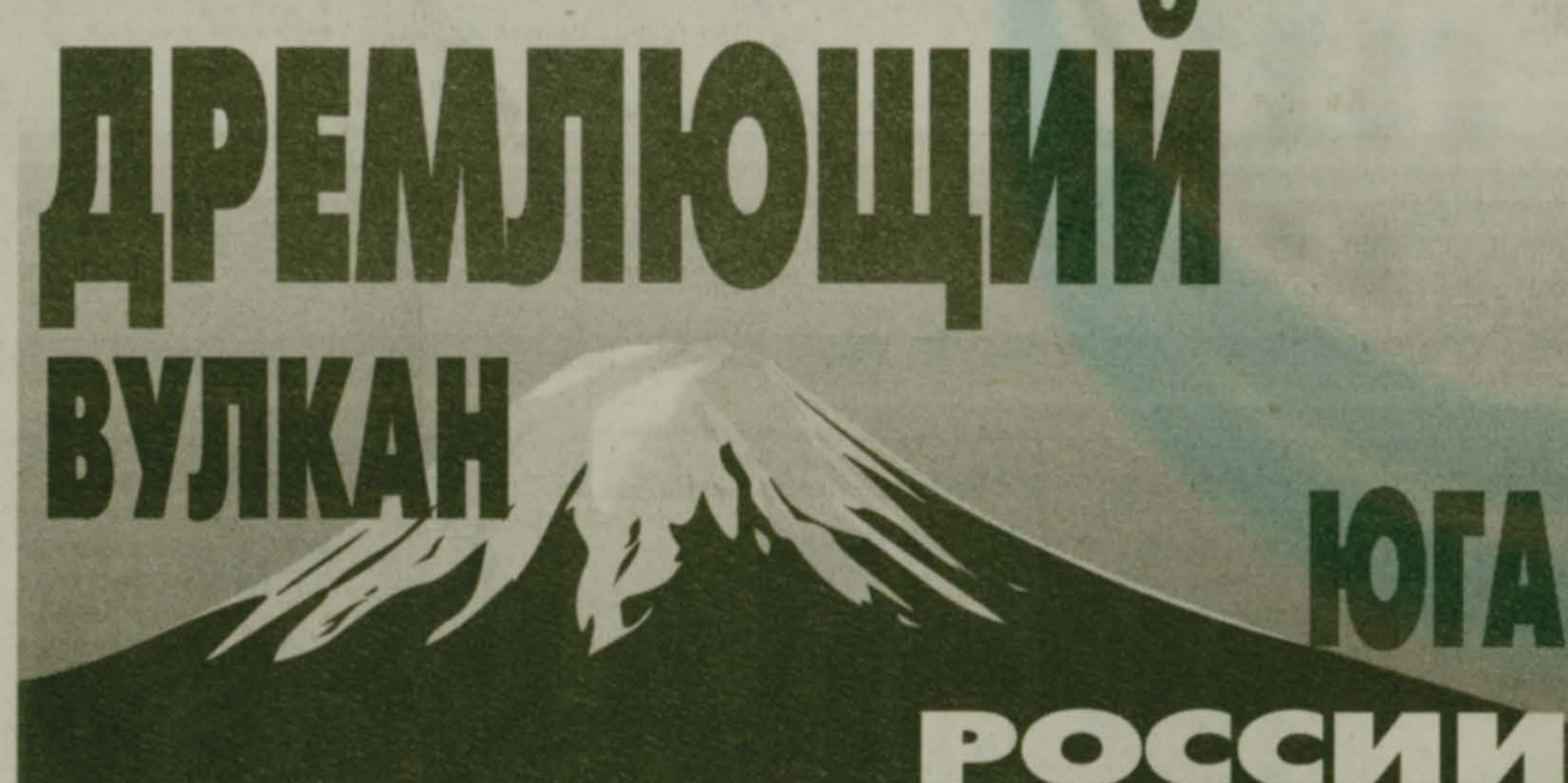
РАЗРЕШЕНИЕ СИТУАЦИИ В КАРАЧАЕВО-ЧЕРКЕССИИ НЕОБХОДИМО ДЛЯ СТАБИЛИЗАЦИИ ОБСТАНОВКИ НА СЕВЕРНОМ КАВКАЗЕ