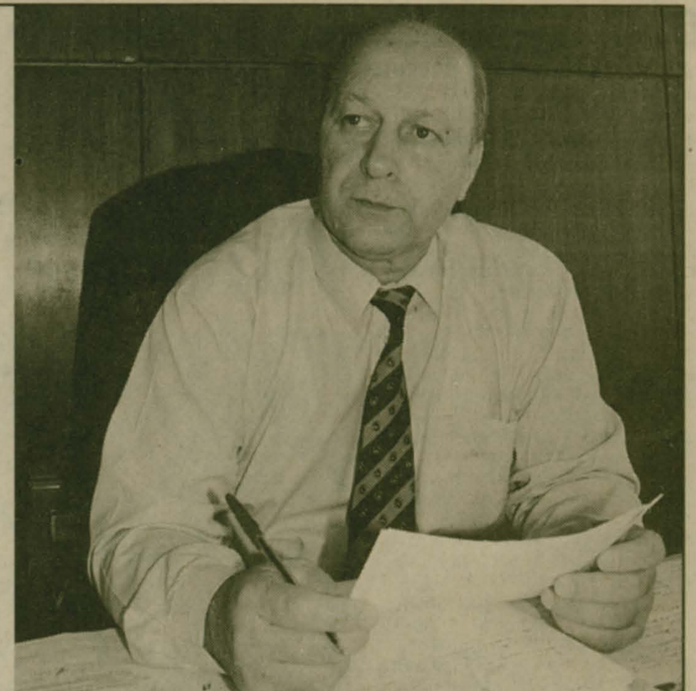
Академик В. А. Лисичкин разрабатывает программу спасения профобразования...