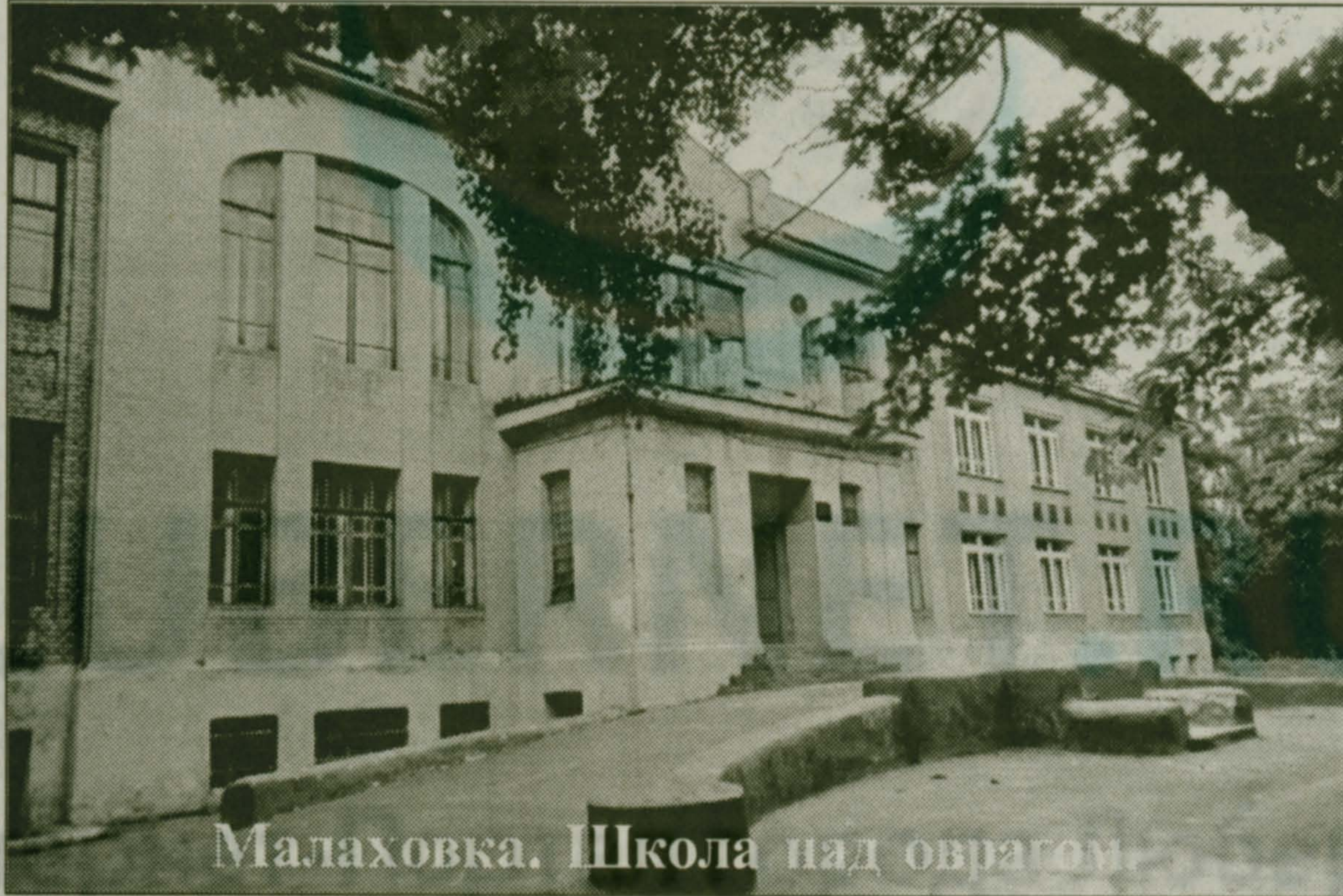
Малаховка. Школа над оврагом.

ПН 1 8 15 22 29 ВТ 2 9 16 23 30 СР 3 10 17 24 ЧТ 4 11 18 25 ПТ 5 12 19 26 СБ 6 13 20 27 ВС 7 14 21 28