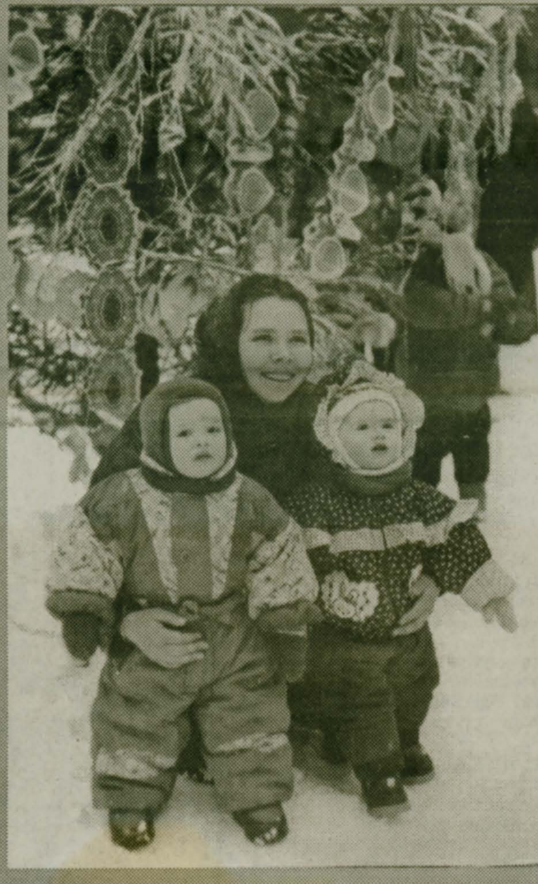
Фото и текст П.САЖИНА

В первый день после Рождества с утра шёл снежок, а днём - так и вовсе дождь. Тем не менее праздник Рождественской ёлки в парке Малаховского Летнего театра получился весёлым и интересным. На средства, выделенные администрацией посёлка, были приглашены артисты, дети читали стихи, пели песни, водили хороводы. Можно было полакомиться горячими блинами, чаем из самовара, всевозможными сладостями. Так что праздник удался на славу!