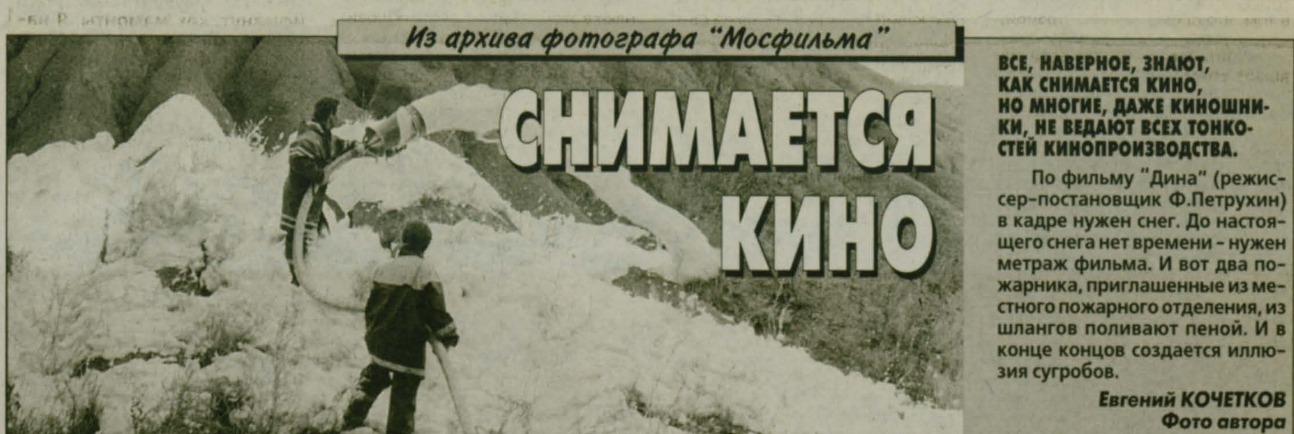
Из архива фотографа "Мосфильма"