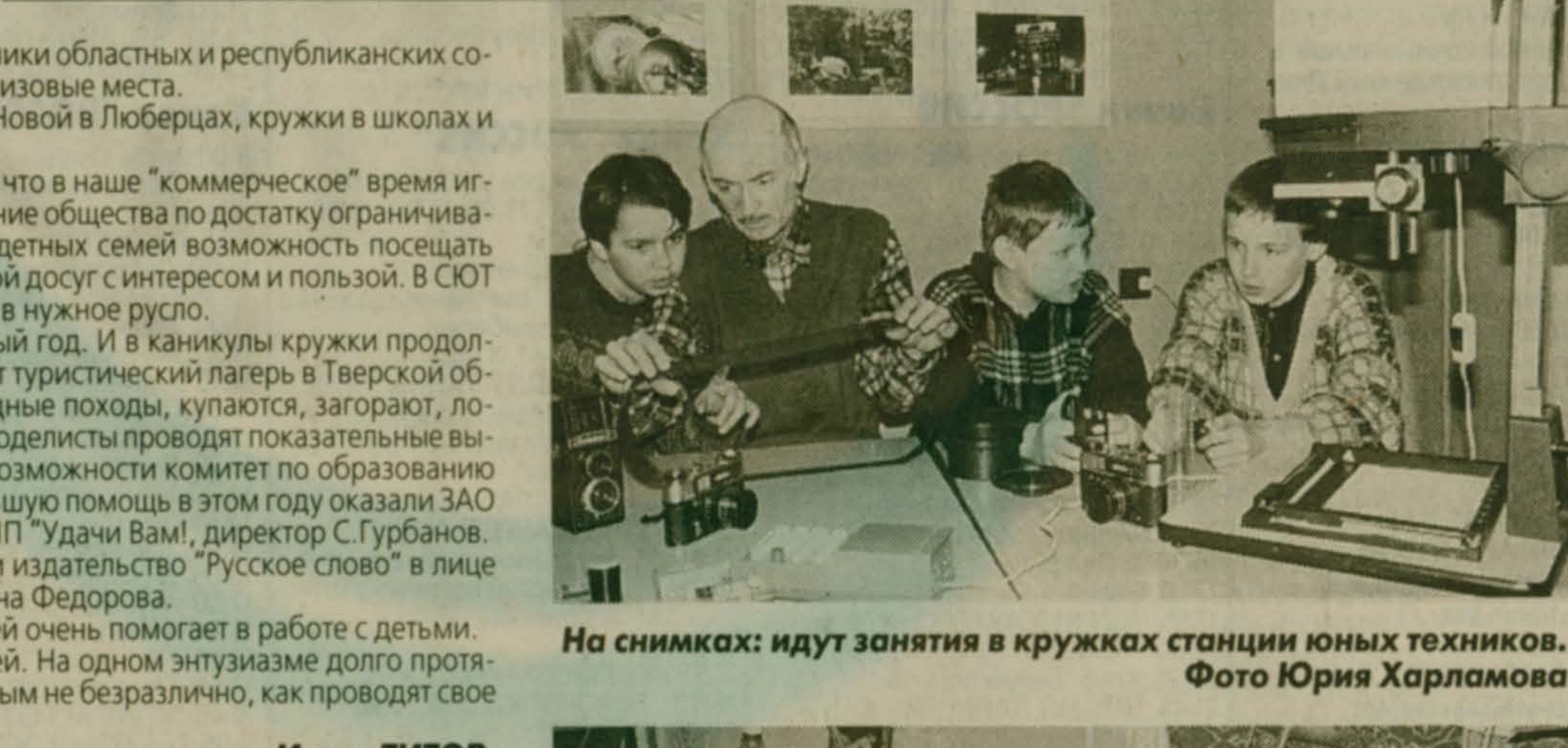
На снимках: идут занятия в кружках станции юных техников.

Моделисты СЮТ - постоянные участники областных и республиканских соревнований, неоднократно занимали призовые места. Два филиала, на ул. Урицкого и ул. Новой в Люберцах, кружки в школах и клубах при ЖЭУ дают знания ребятам.