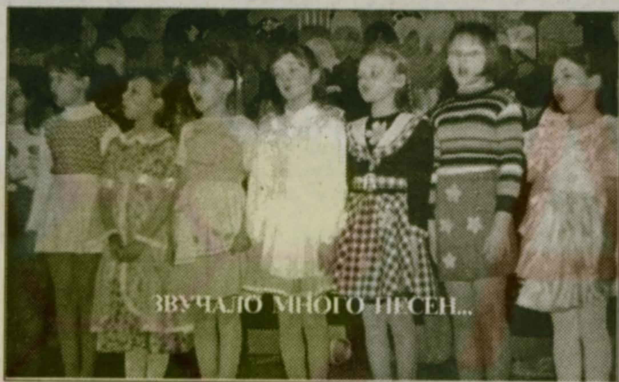
ЗВУЧАЛО МНОГО ПЕСЕН...