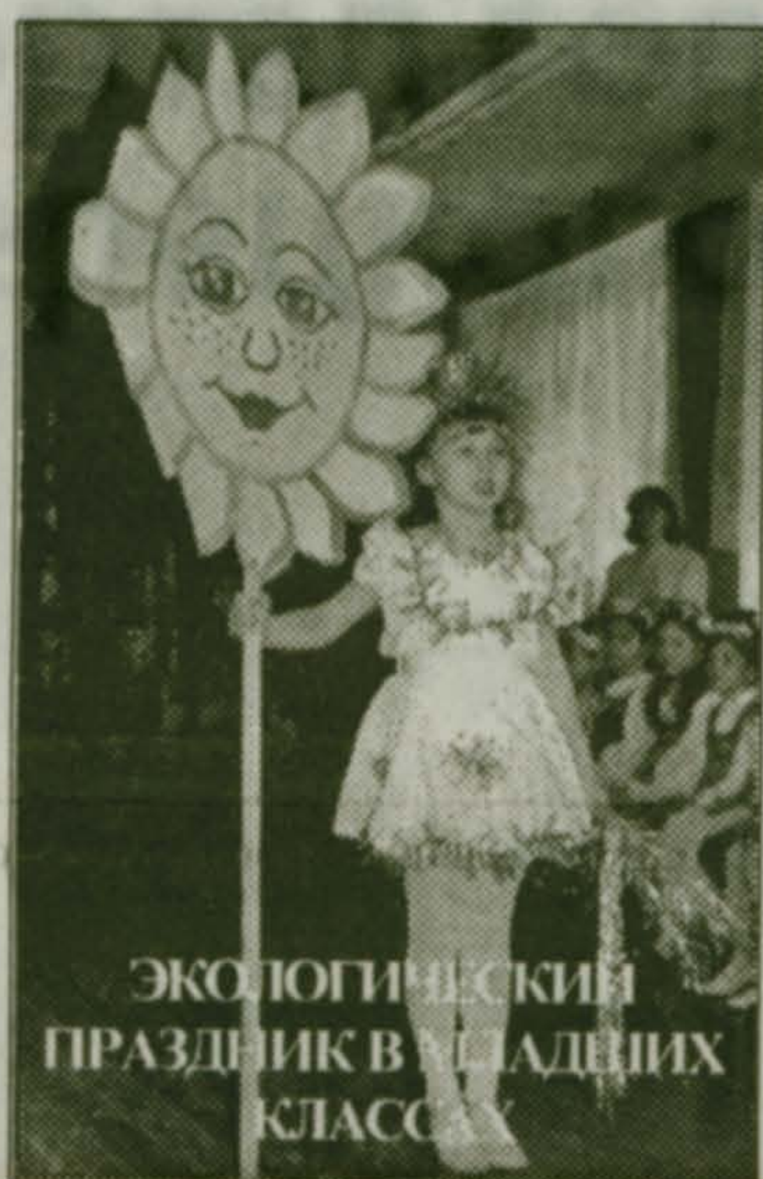
ЭКОЛОГИЧЕСКИЙ ПРАЗДНИК В МАЛАХОВСКОЙ ШКОЛЕ №52

Все было интересно для собравшихся педагогов (действительно собравшихся для обмена опытом). Но чувствовалось, интересом к происходящему прониклись и дети. Что особенно ценно. Их выступления в актовом зале и рекреациях говорили за это. Одна жалость - мало родителей слышало эти чистые звонкие голоса: что грешно и преступно разорять птичьи гнезда, загрязнять воду, которую пьем, и воздух, которым дышим... Иным бы совсем не мешало услышать это от собственных детей. Некоторых малышей, я видел, после их выступления взрослые сни-