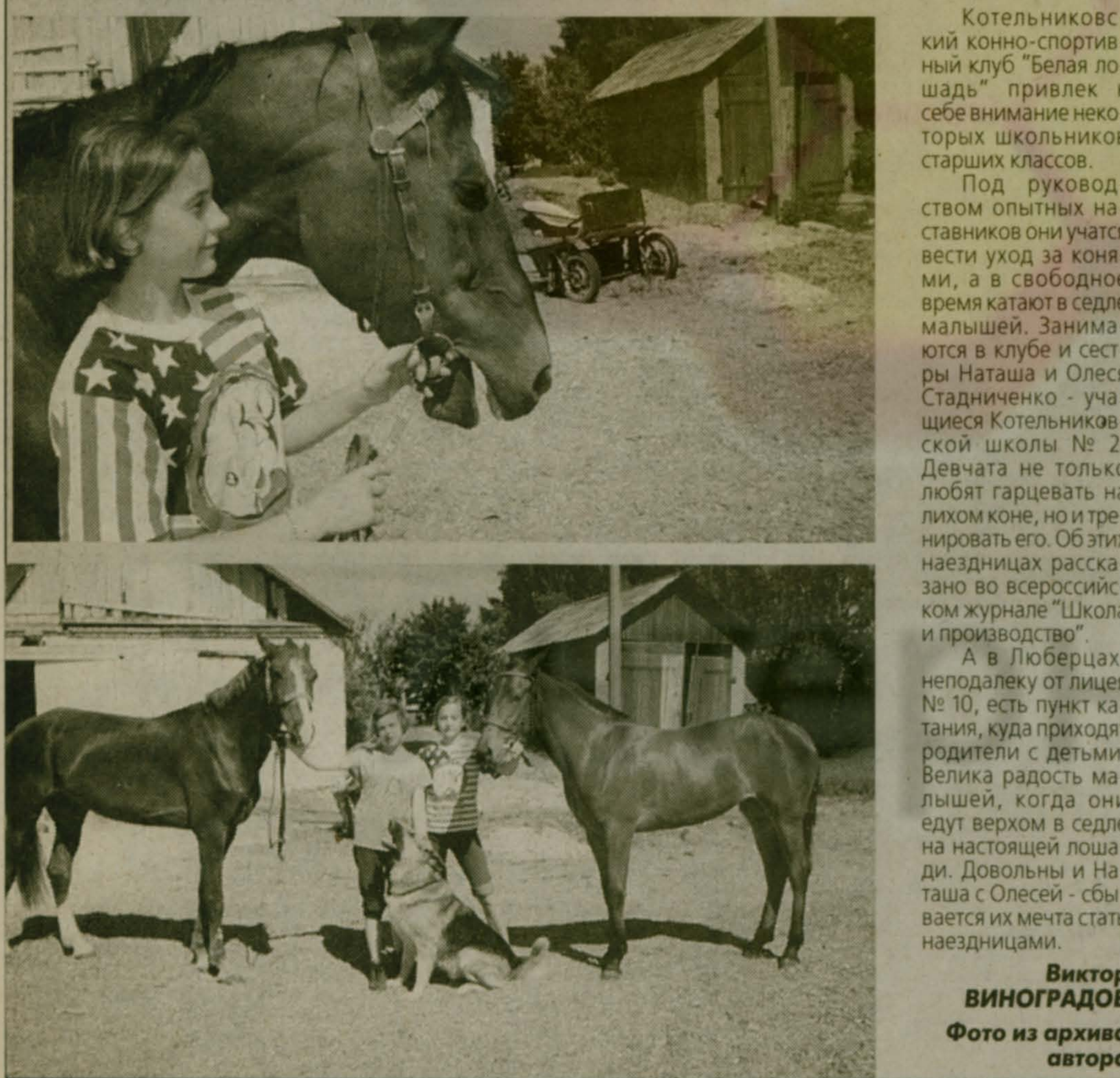
Виктор Виноградов Фото из архива автора