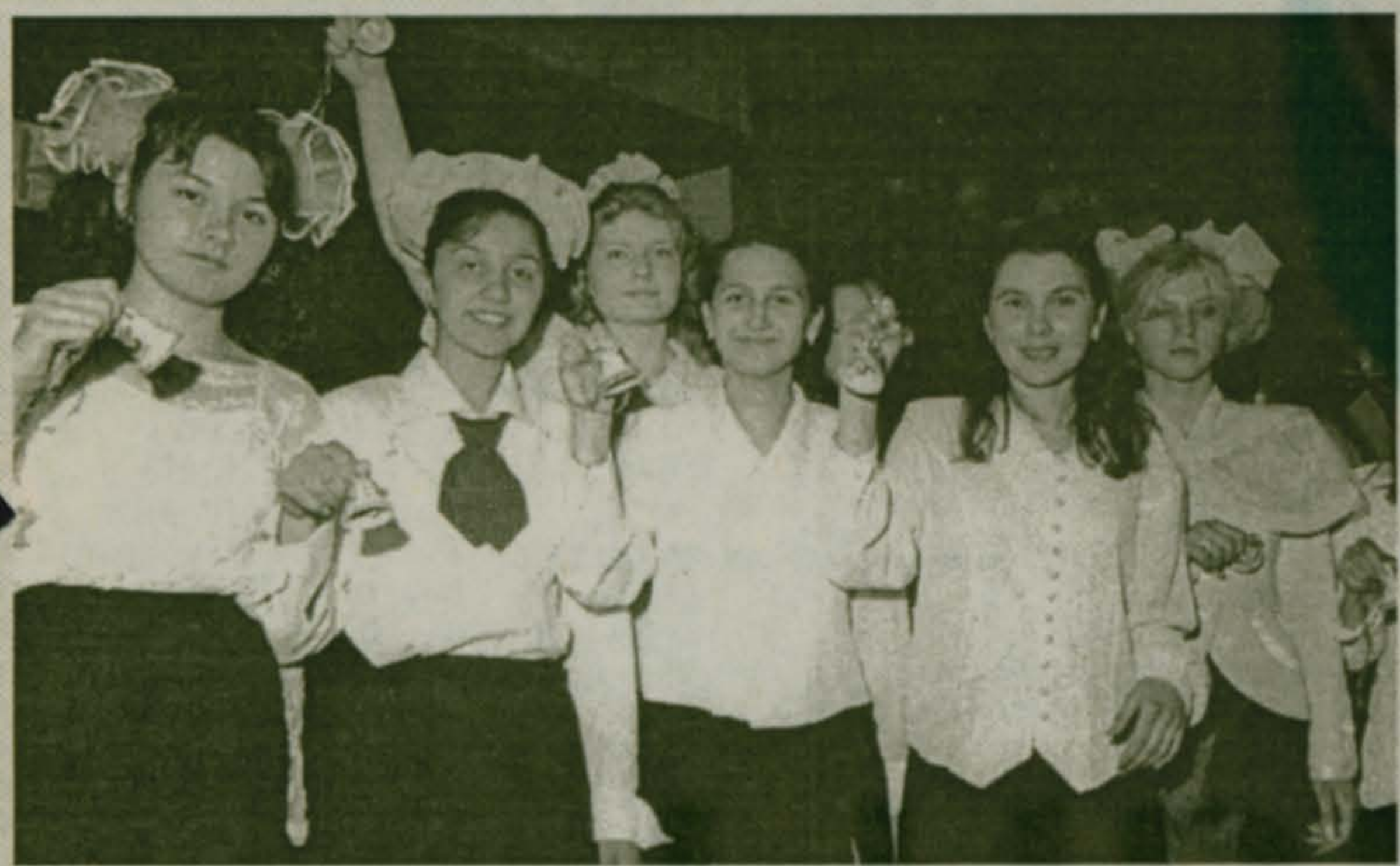
Последний звонок в 46-й гимназии...