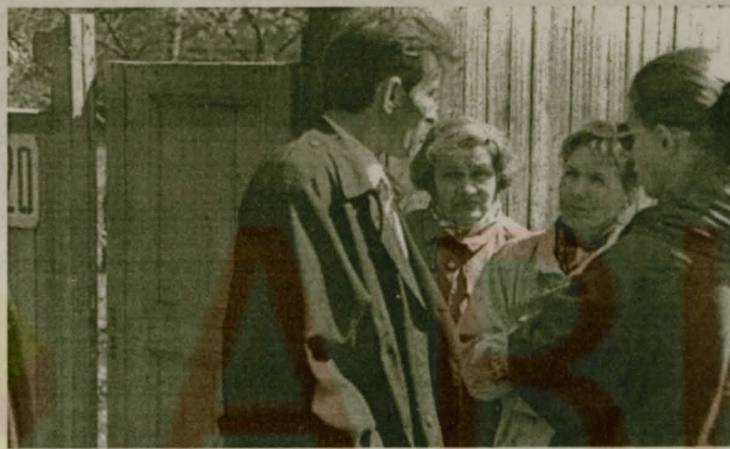
Рейд администрации по проверке состояния улиц посёлка.

Прошел субботник в апреле, в мае минул месячник по санитарной очистке и благоустройству поселка. Убрана масса стихийных свалок, вывезены горы мусора. Заметно чище стало в поселке. Но, увы, мы все еще далеки от того, чтобы назвать существующий порядок образцовым.