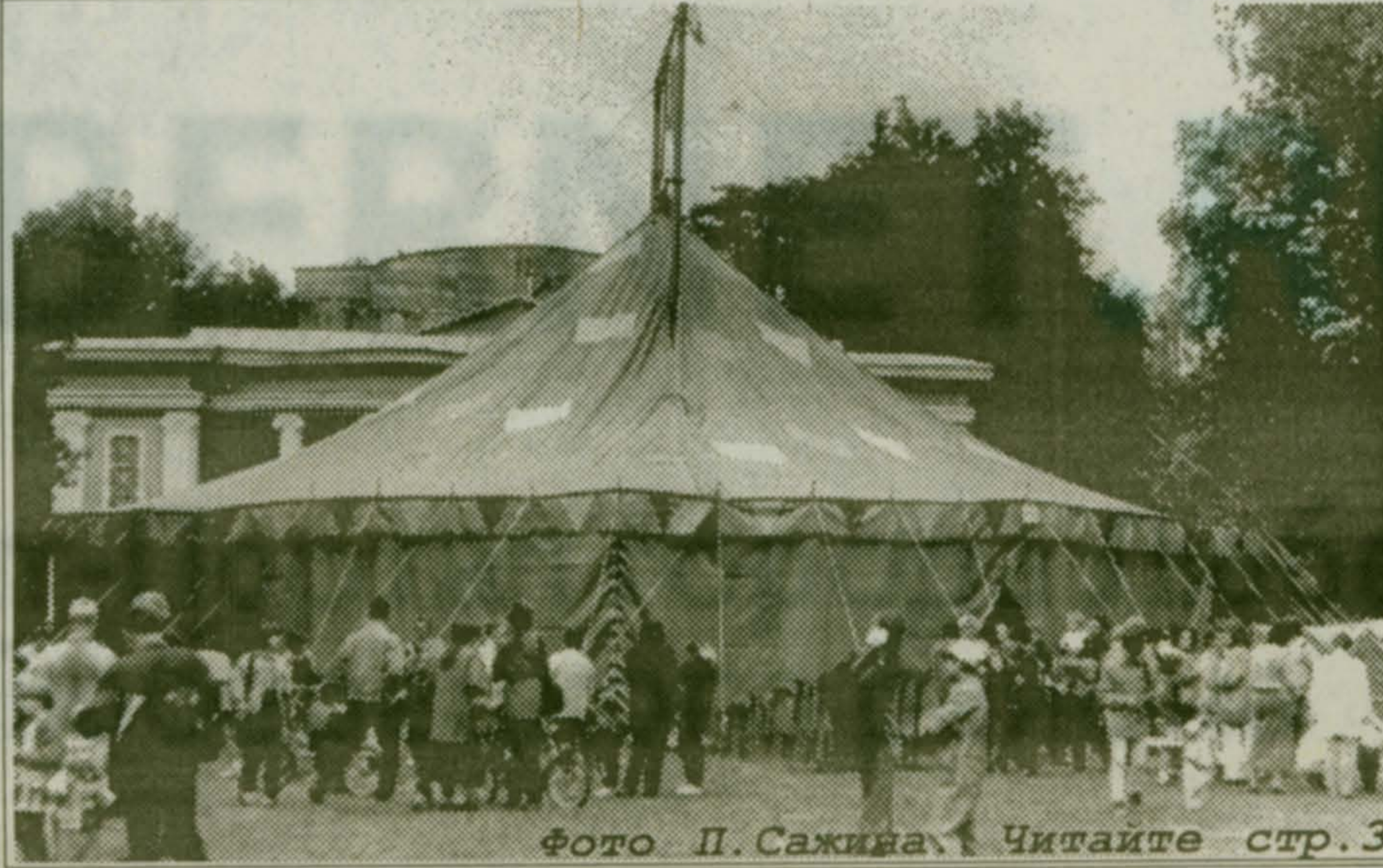
Читайте стр. 3