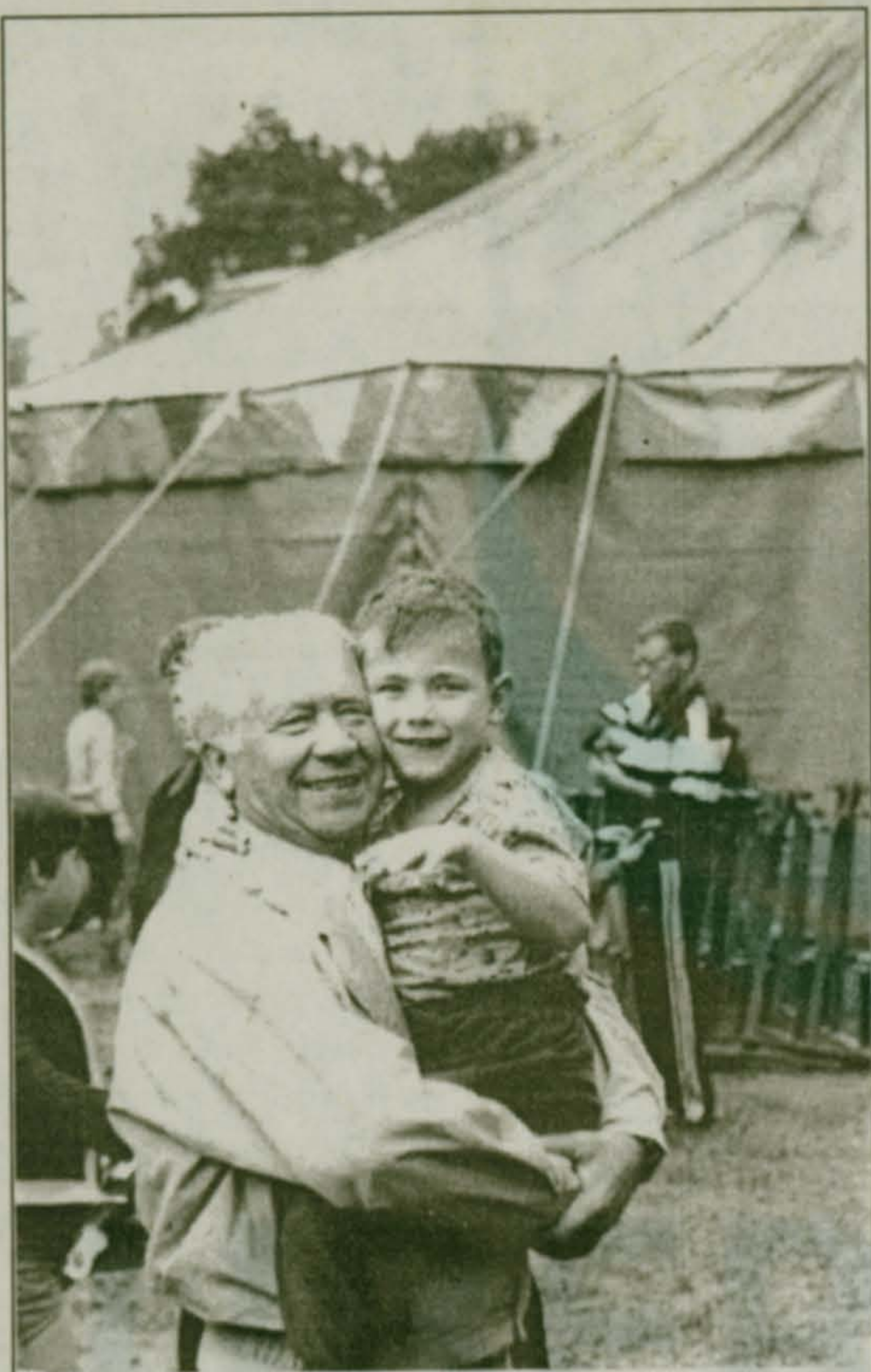
Мы любим вместе гулять - в Летнем парке...

23 августа. Лаврентьев день. «Осень и зима хороши живут, коли на Лаврентия вода тиха и дождик».