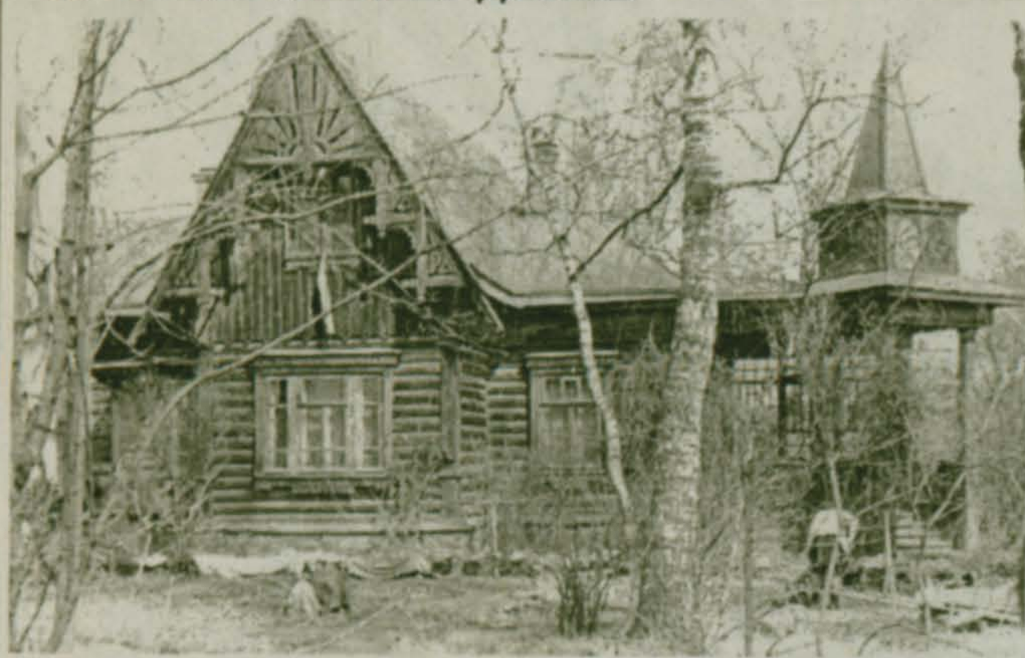
На двух фотографиях (из фондов музея) 70-х годов – частные дома постройки начала века. Улица Советская, 15 - дом Мыслина. И улица Республиканская, 50 - дача Озеровой (Шпигель).