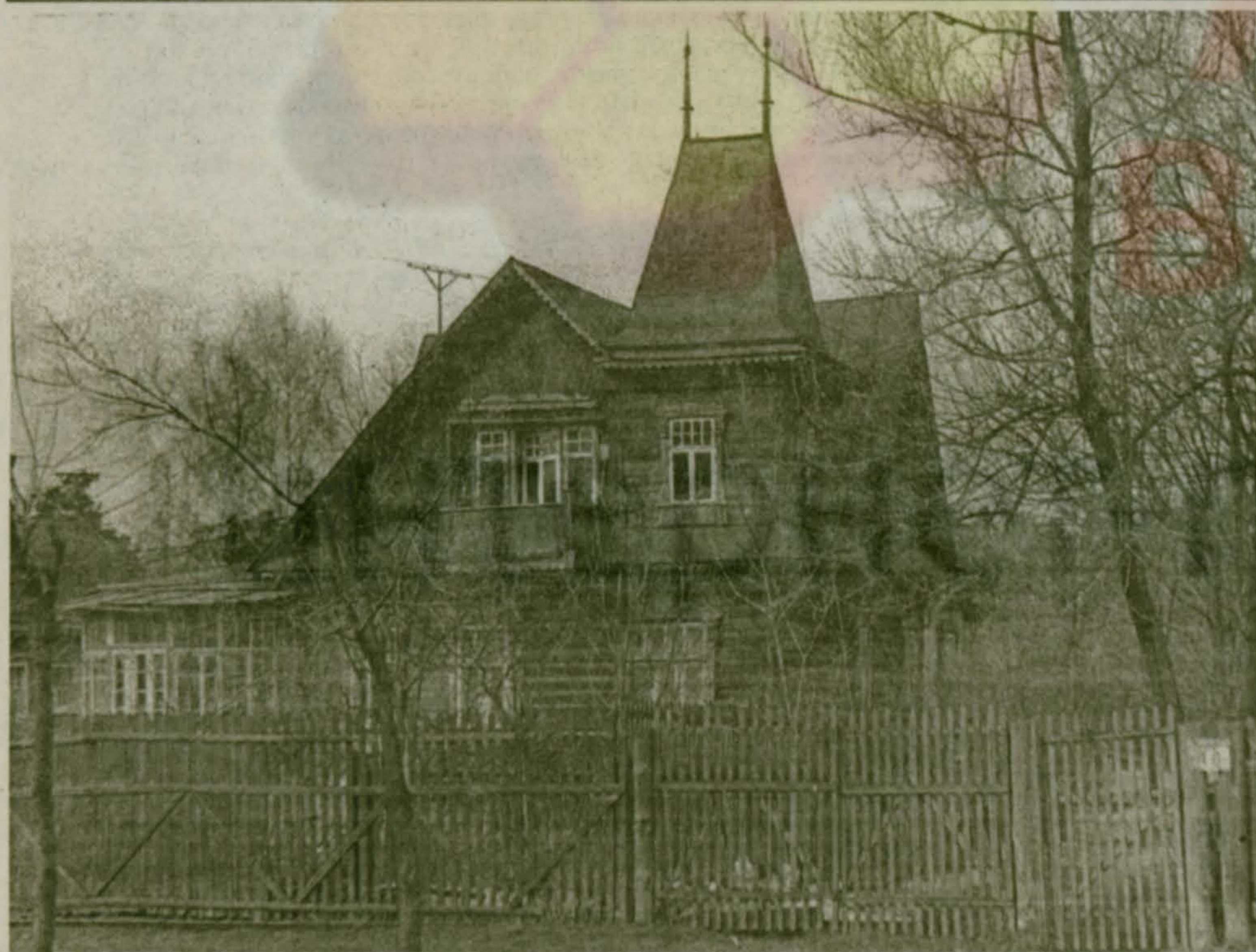
Улица Республканская, дом 48.