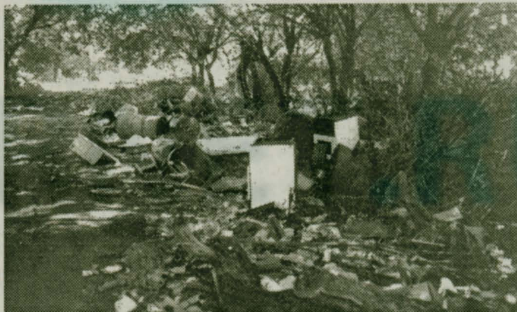
...середина улицы Кирова...