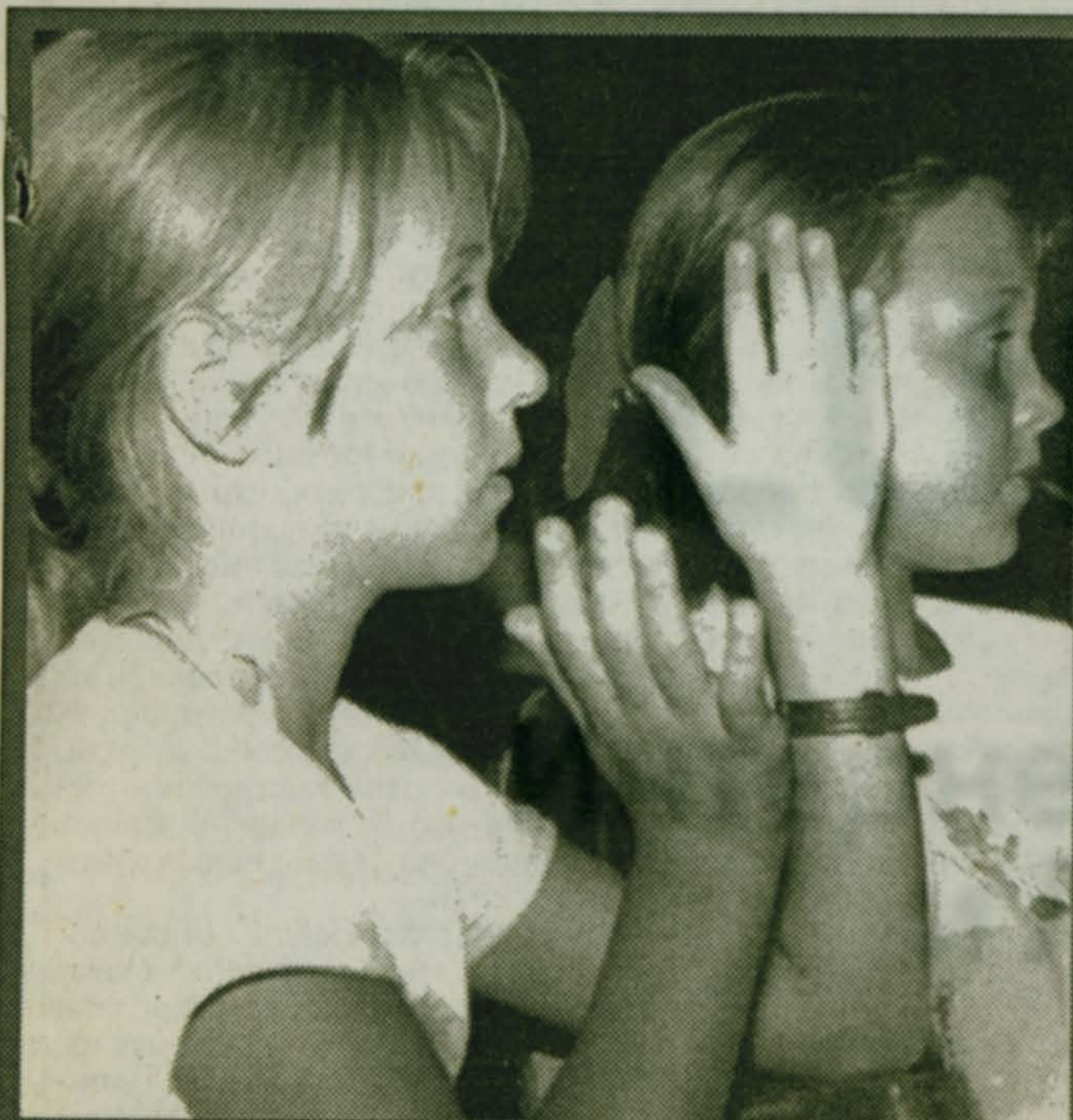
Путь к знаниям...

Издавался в 1913 г. Возобновлен в 1991 г.