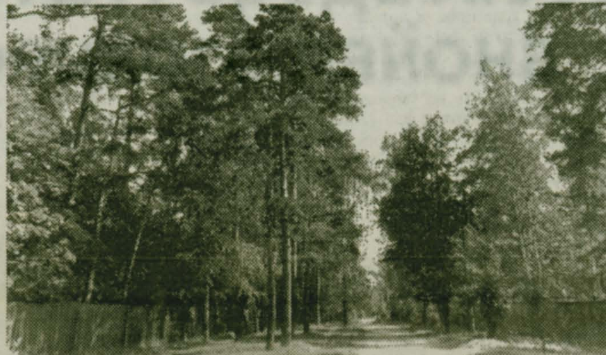
...конец улицы Кирова...

ливают несдаваемую стеклотару, и школьники весело бьют кучи ненужных бутылок о бетонные стены «недостройки». Грохот стоит такой, что не только люди - дворные собаки становятся психованными.