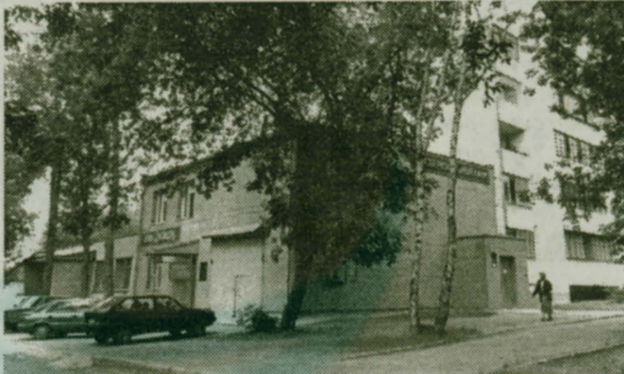
Начало улицы Кирова...

Обвинить в появлении свалки только жителей улицы было бы несправедливо, хотя и они свою «лепту» вносят. По сложившейся подлой привычке мусор сюда тащат отовсюду, привозят на машинах и тележках. Мешками выва-