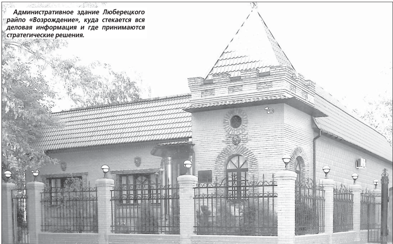
Административное здание Люберецкого райпо «Возрождение», куда стекается вся деловая информация и где принимаются стратегические решения.