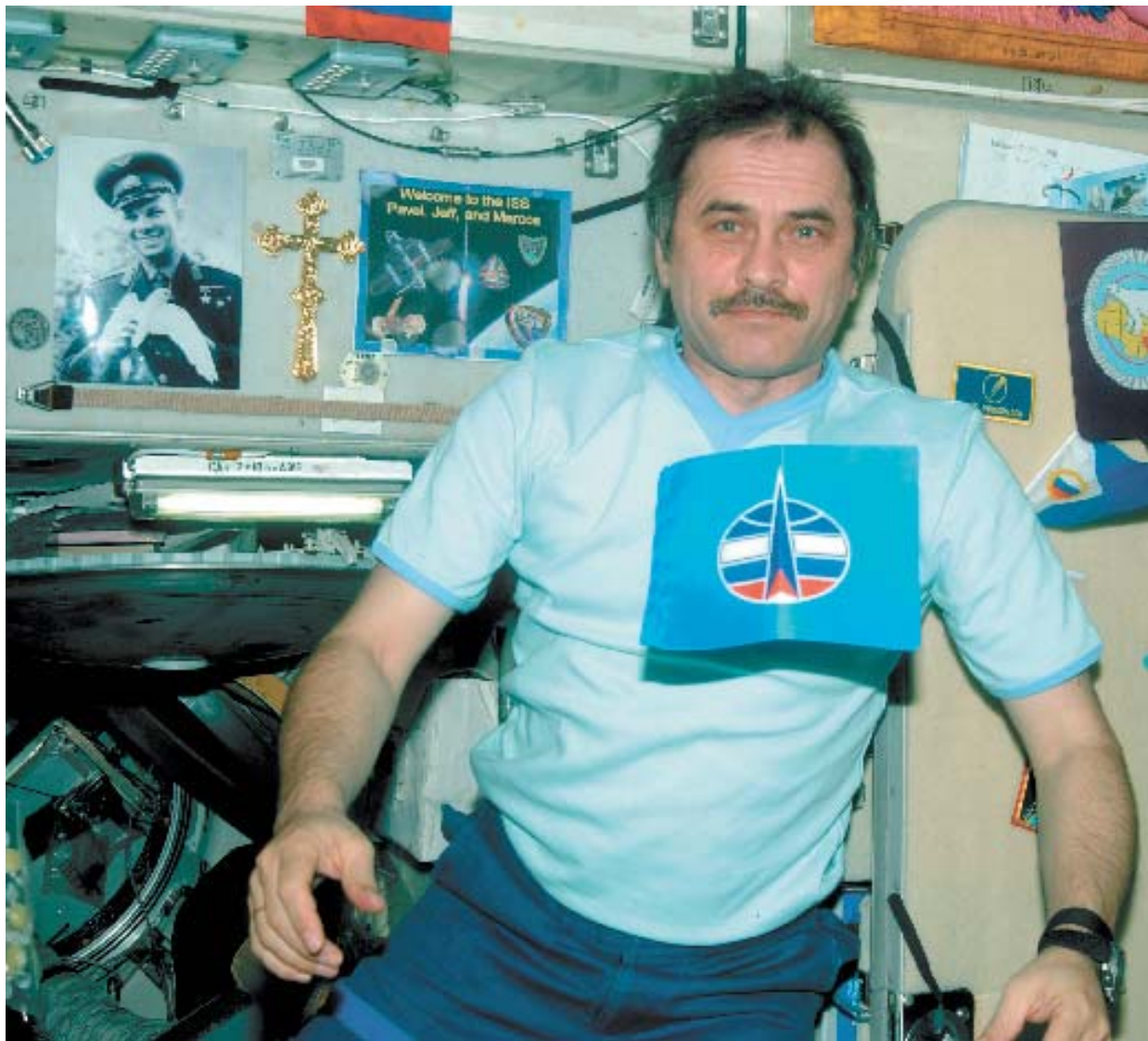
Снимок сделан в российском модуле МКС-13.