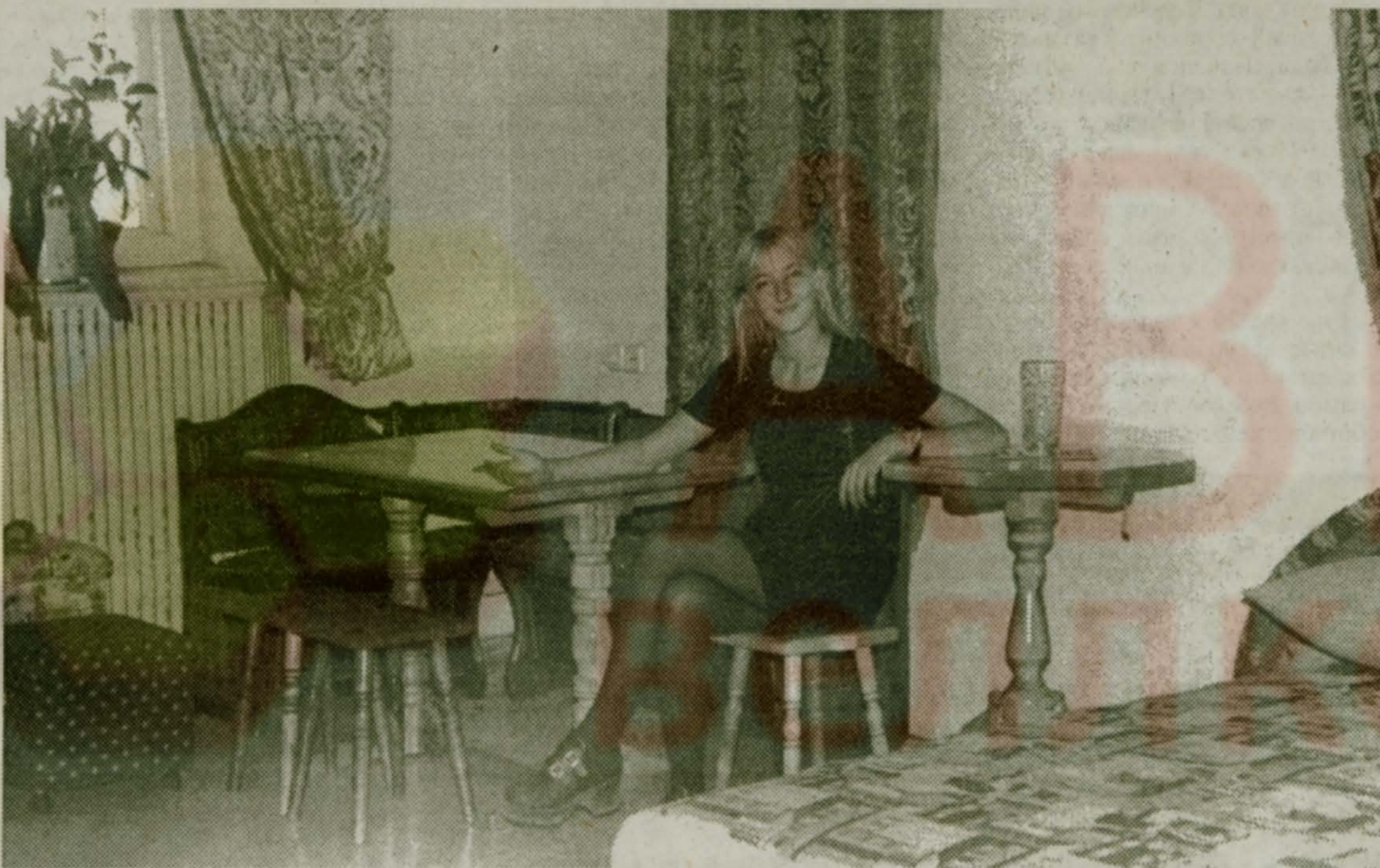
Продолжение темы - на 3-й странице