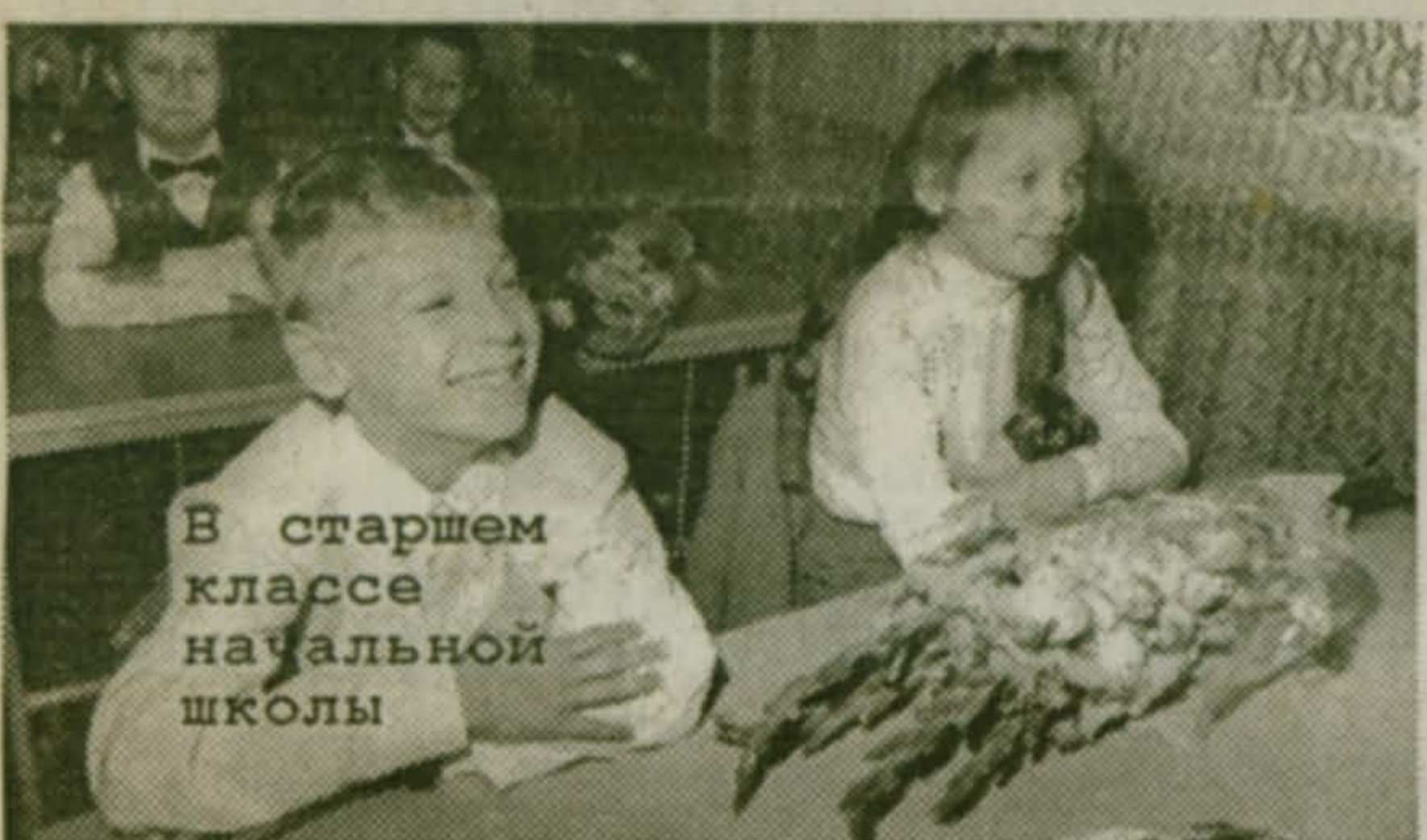
В старшем классе начальной школы

А насчет съеденных - так на вкус и цвет товарищей нет... В.ЗАДОРНОВА