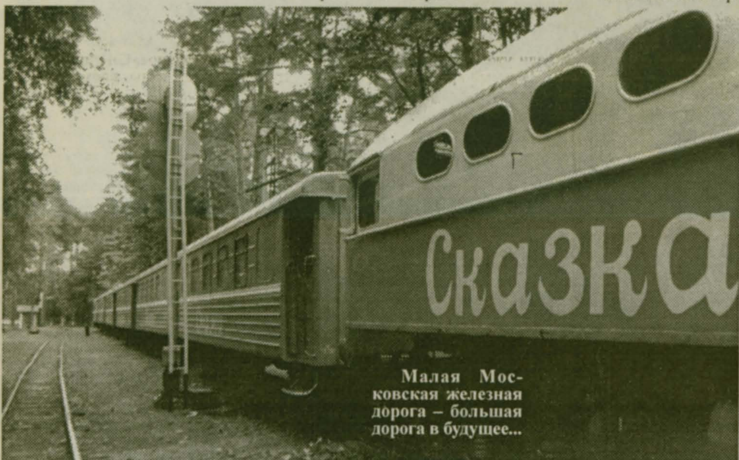
Малая Московская железная дорога - большая дорога в будущее...