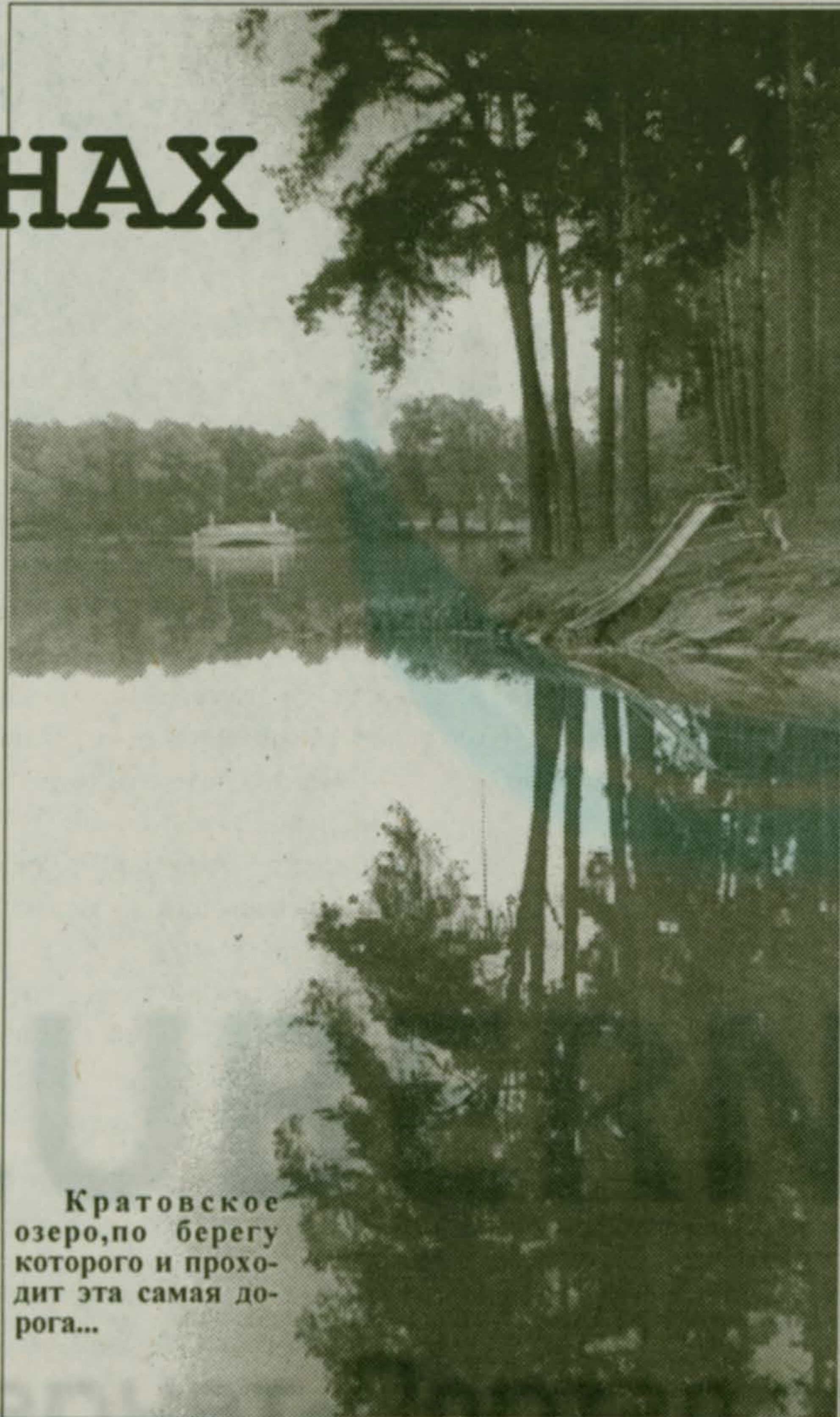
Кратовское озеро, по берегу которого и проходит эта самая дорога...

Насколько большое значение придается работе детских дорог в России, можно судить по тому, что, когда за недостатком средств встал вопрос об их закрытии, специальным