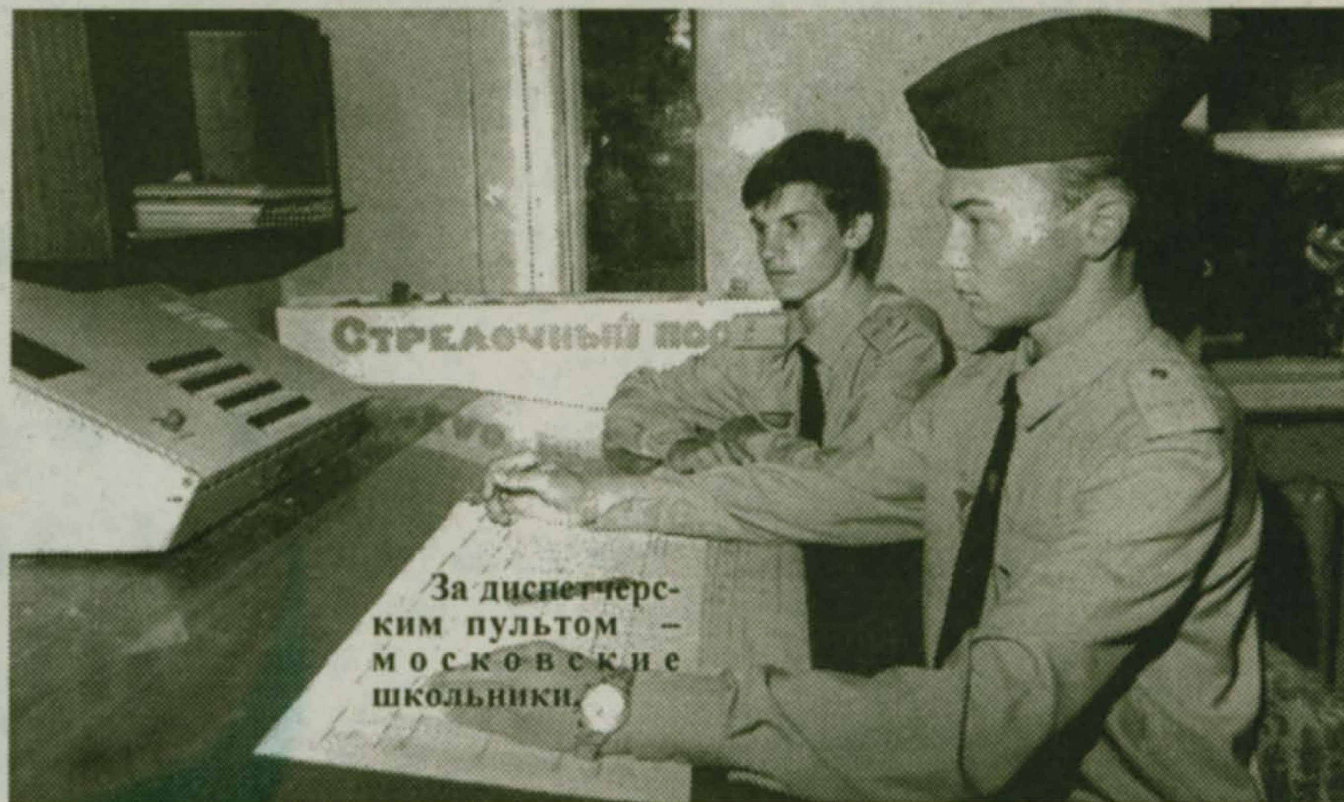
За диспетчерским пультом - московские школьники.