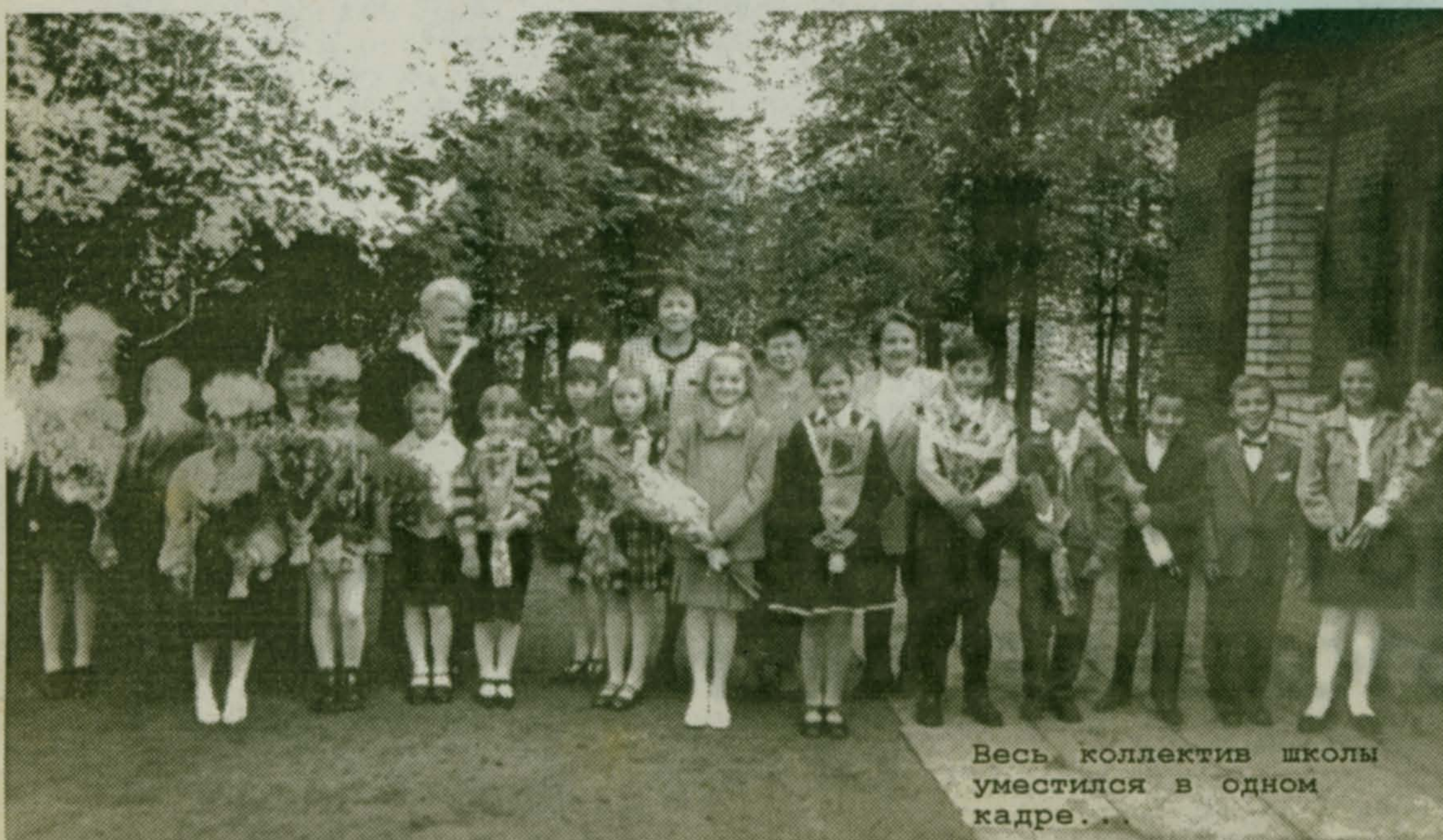
Весь коллектив школы уместился в одном кадре.