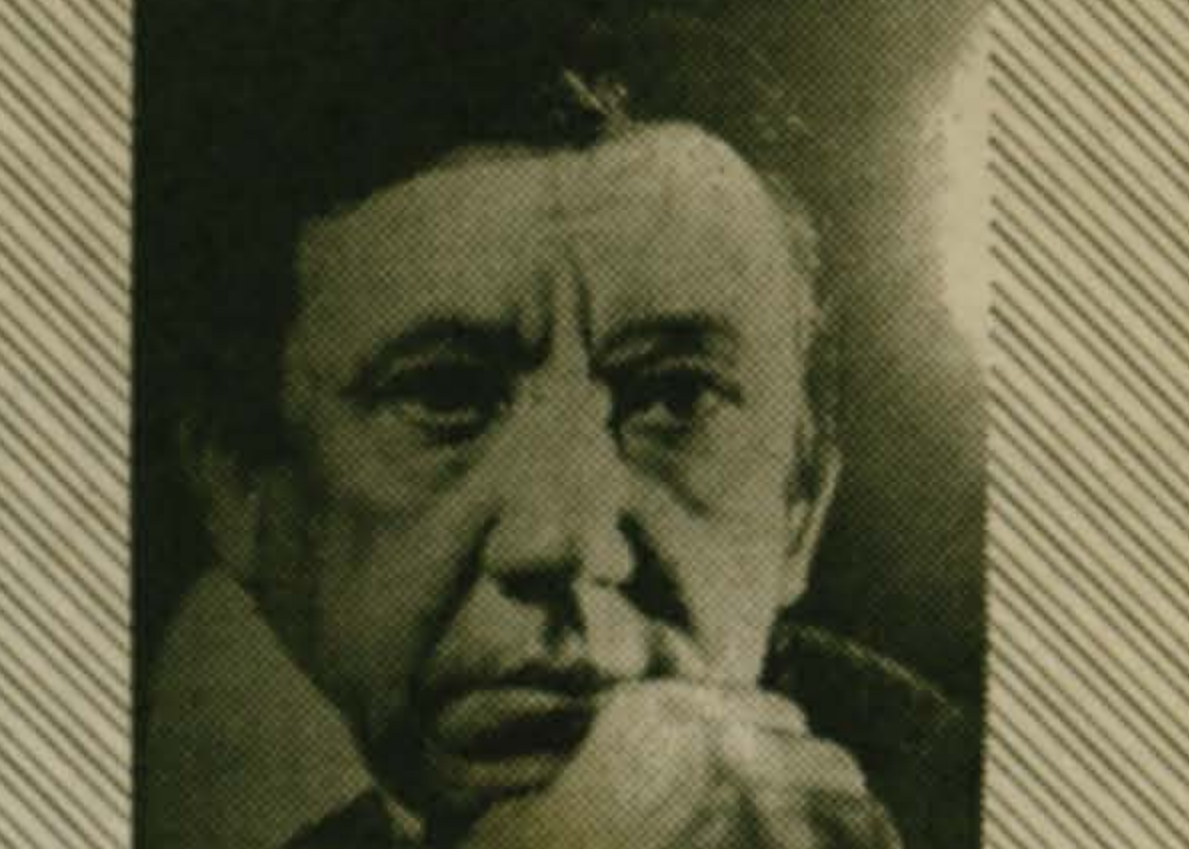
Ларисе и Ивану на память о нашей прекрасной встрече. Юрий НИКУЛИН, 1979 г.