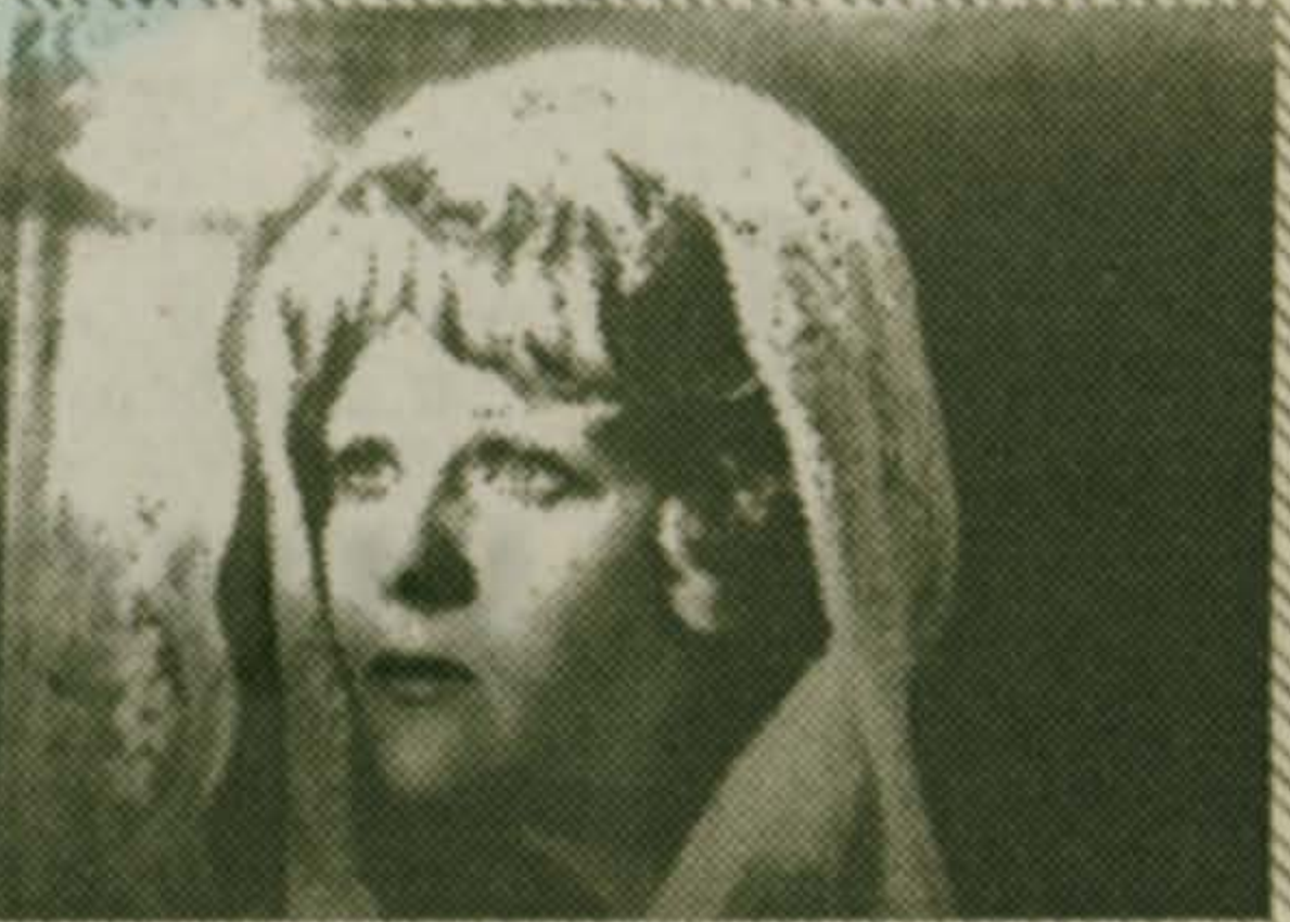
Мы живем однажды - мы должны быть счастливы. И как "Сладкая женщина", я в первую очередь хочу пожелать Вам счастья женского!!! Наталья ГУНДАРЕВА, 1977 г.