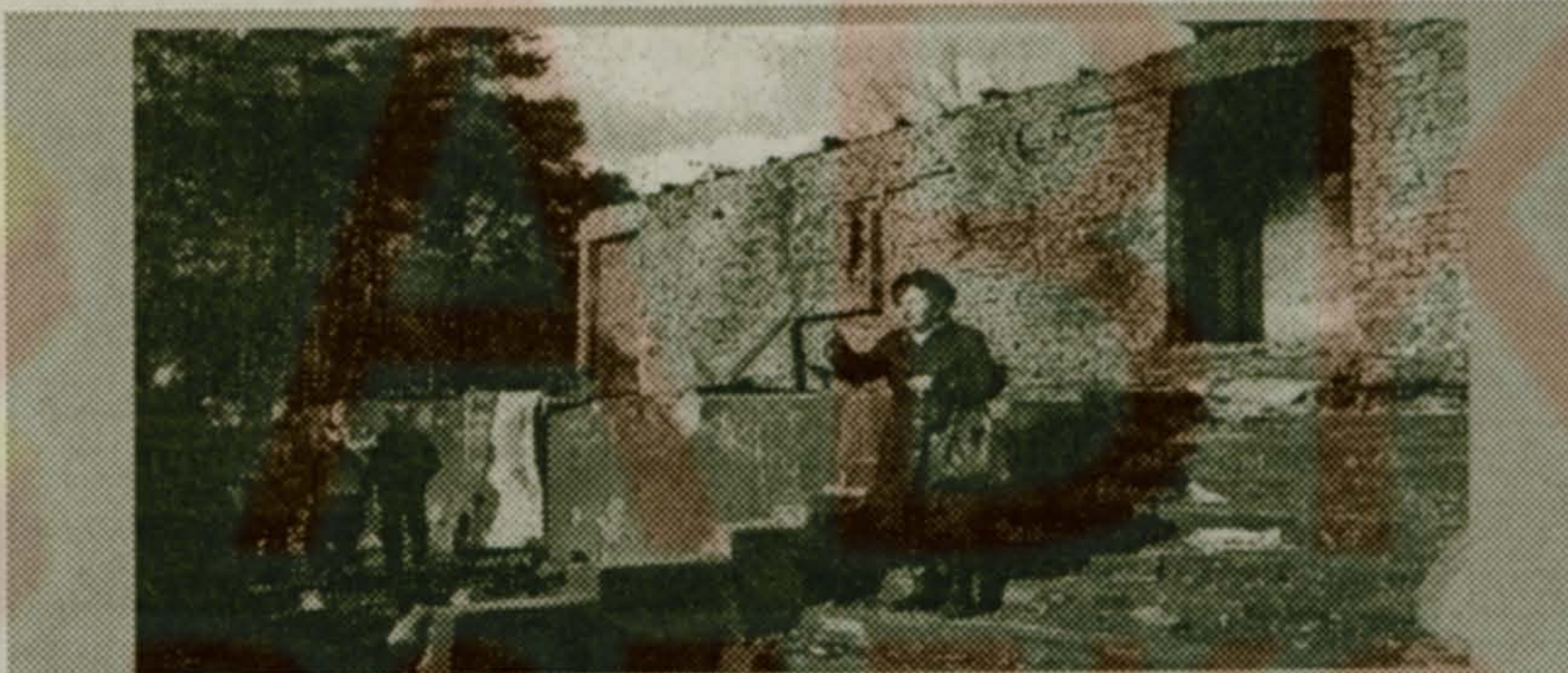
16 октября 2 часа. Импровизированный митинг на ступенях сгоревшего Театра. При всей разности мнений, в главном все сходились: Театр нужно восстанавливать.