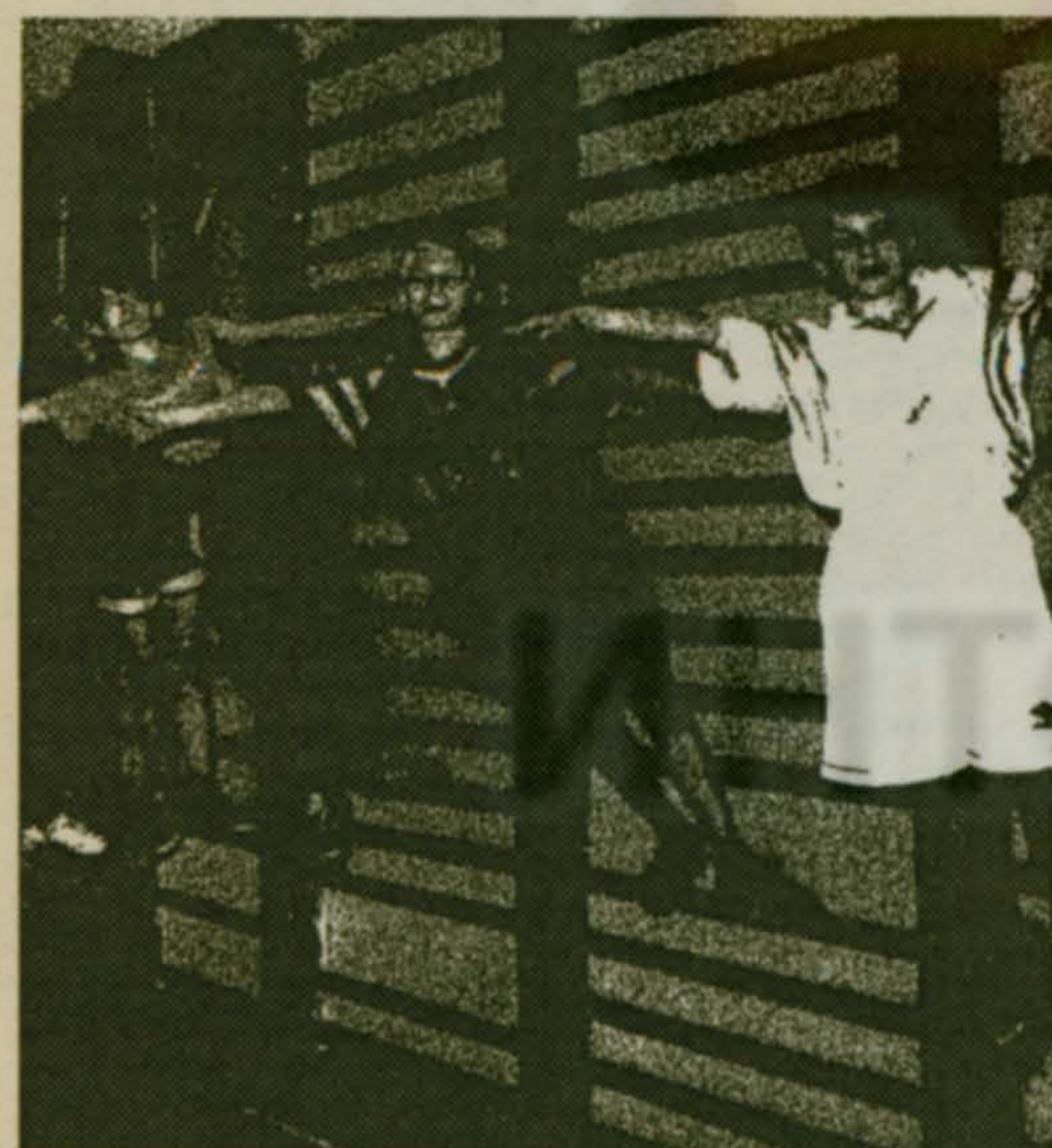
В гимнастическом зале. Здесь формируют осанку детей.

В штате школы-интерната врач терапевт, врач окулист и две медицинские сестры, работающие посменно. В нашем распоряжении оборудованные кабинеты терапевта и окулиста, кабинеты процедурный и заветов, изолятор. Заняты мы не только санитарно-профилактической работой. Специфика нашего учреждения требует совсем другого подхода к работе медицинского персонала.