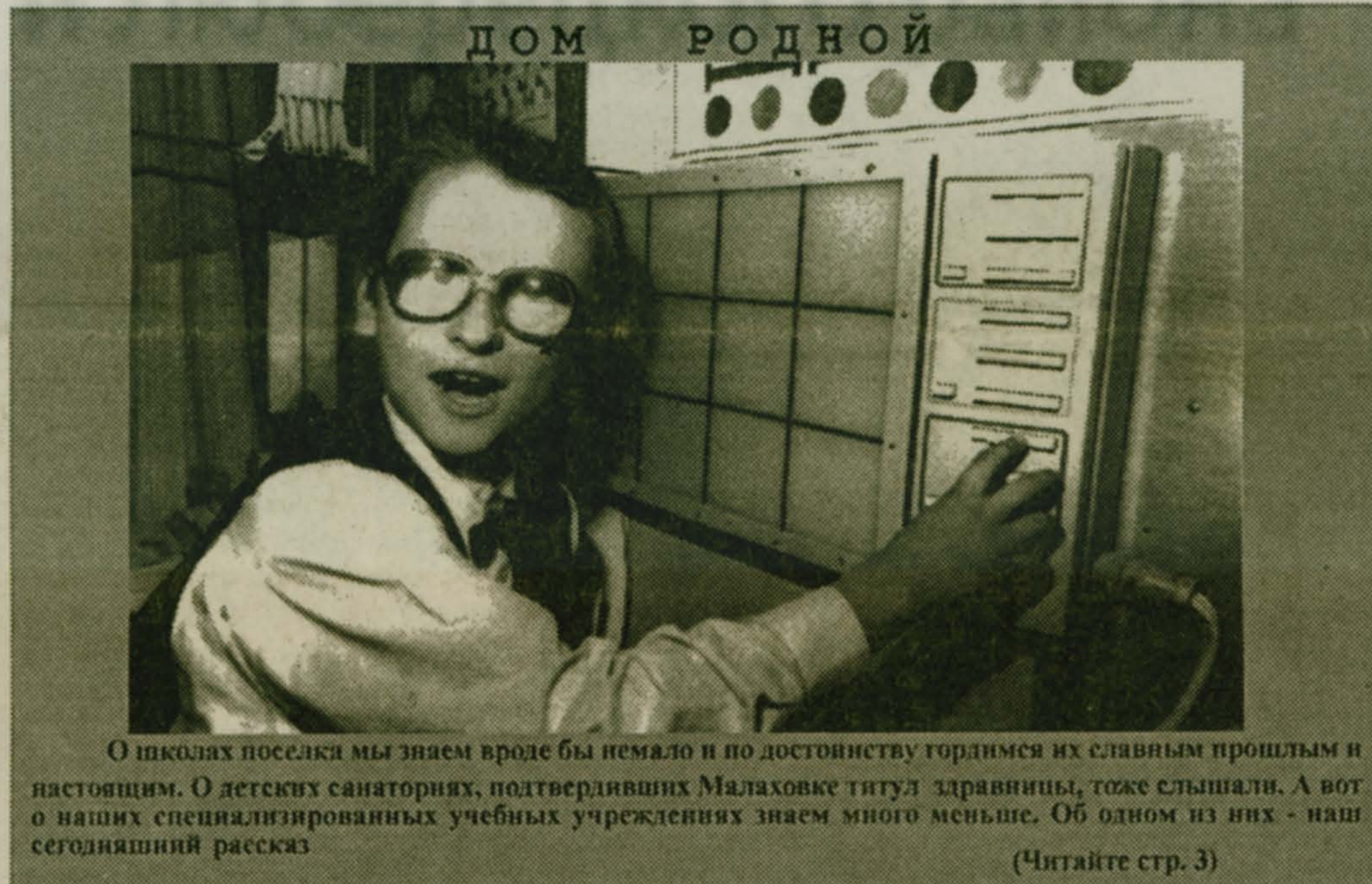
О школах поселка мы знаем вроде бы немало и по достоинству гордимся их славным прошлым и настоящим. О детских санаториях, подтвердивших Малаховке титул "здравницы", тоже слышали. А вот о наших специализированных учебных учреждениях знаем много меньше. Об одном из них - наш сегодняшний рассказ (Читайте стр. 3)