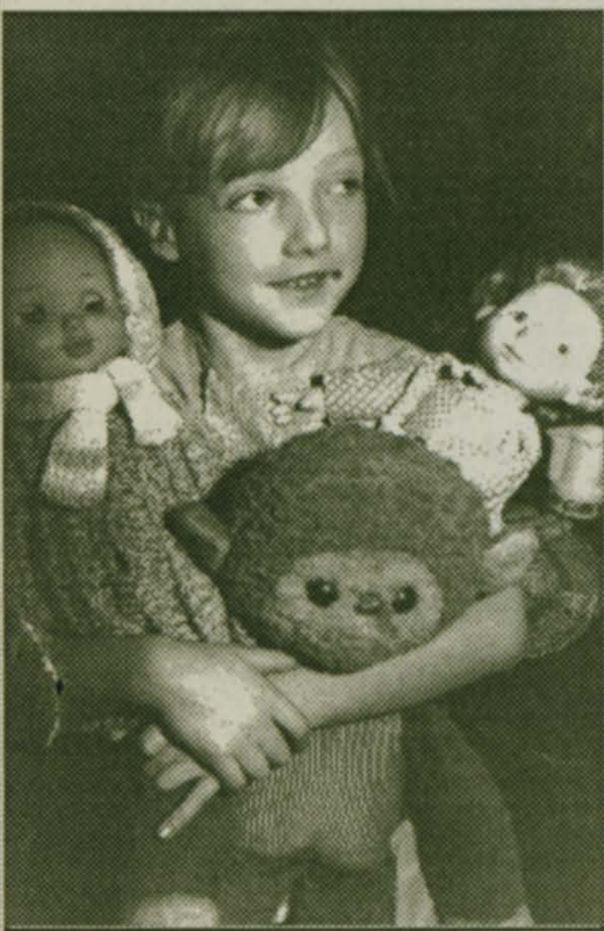
Хорошо, когда кукол много!