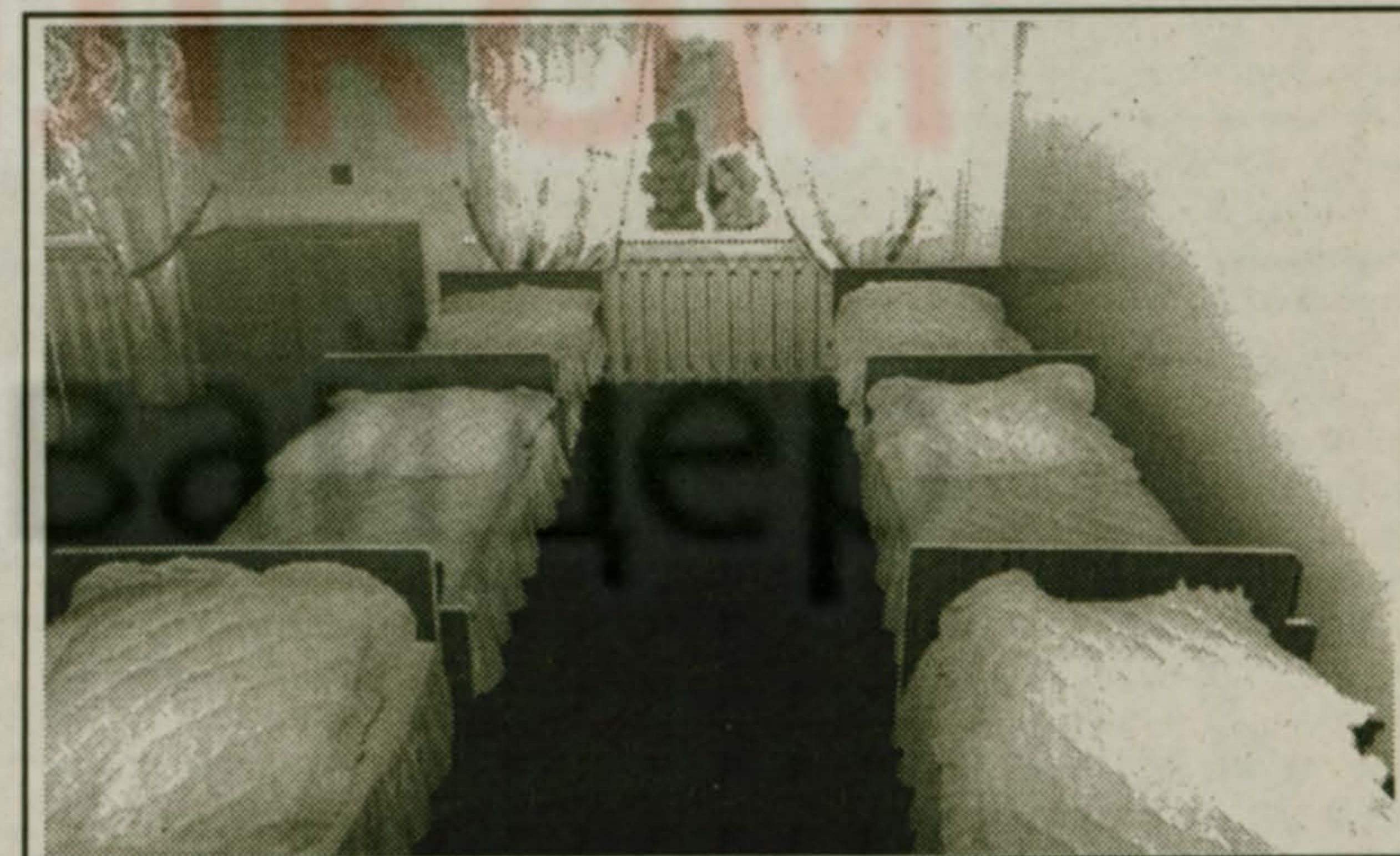
Фото-репортаж из детского дома П.Сажина