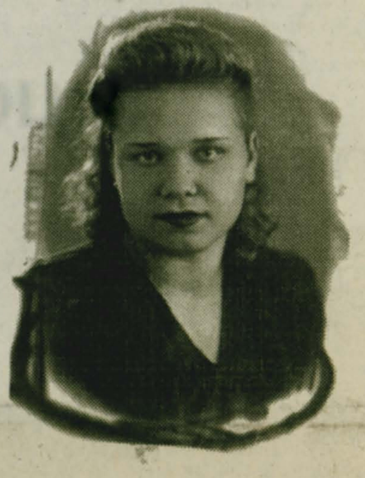
1949 г. Начало пути.