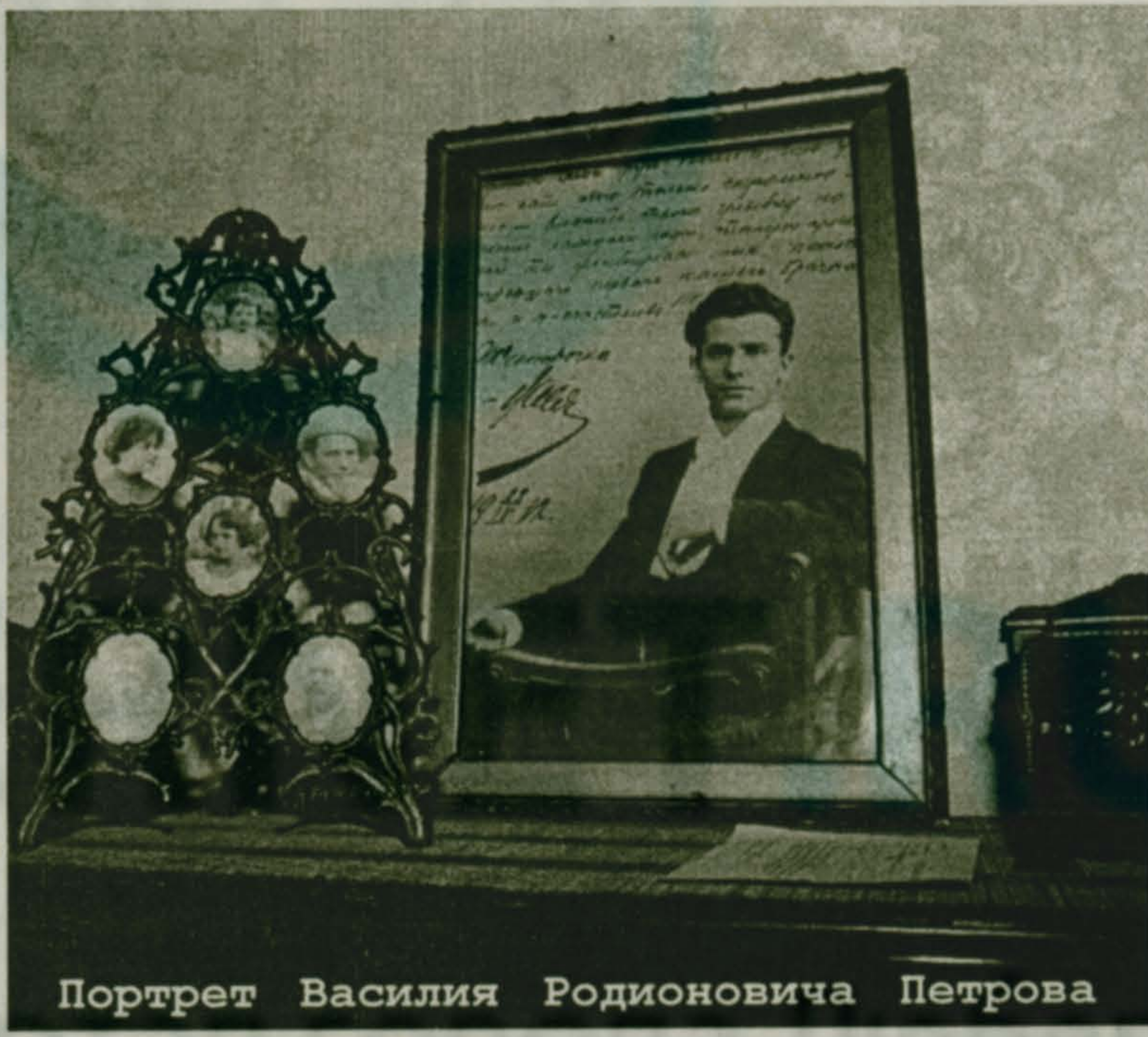
Портрет Василия Родионовича Петрова