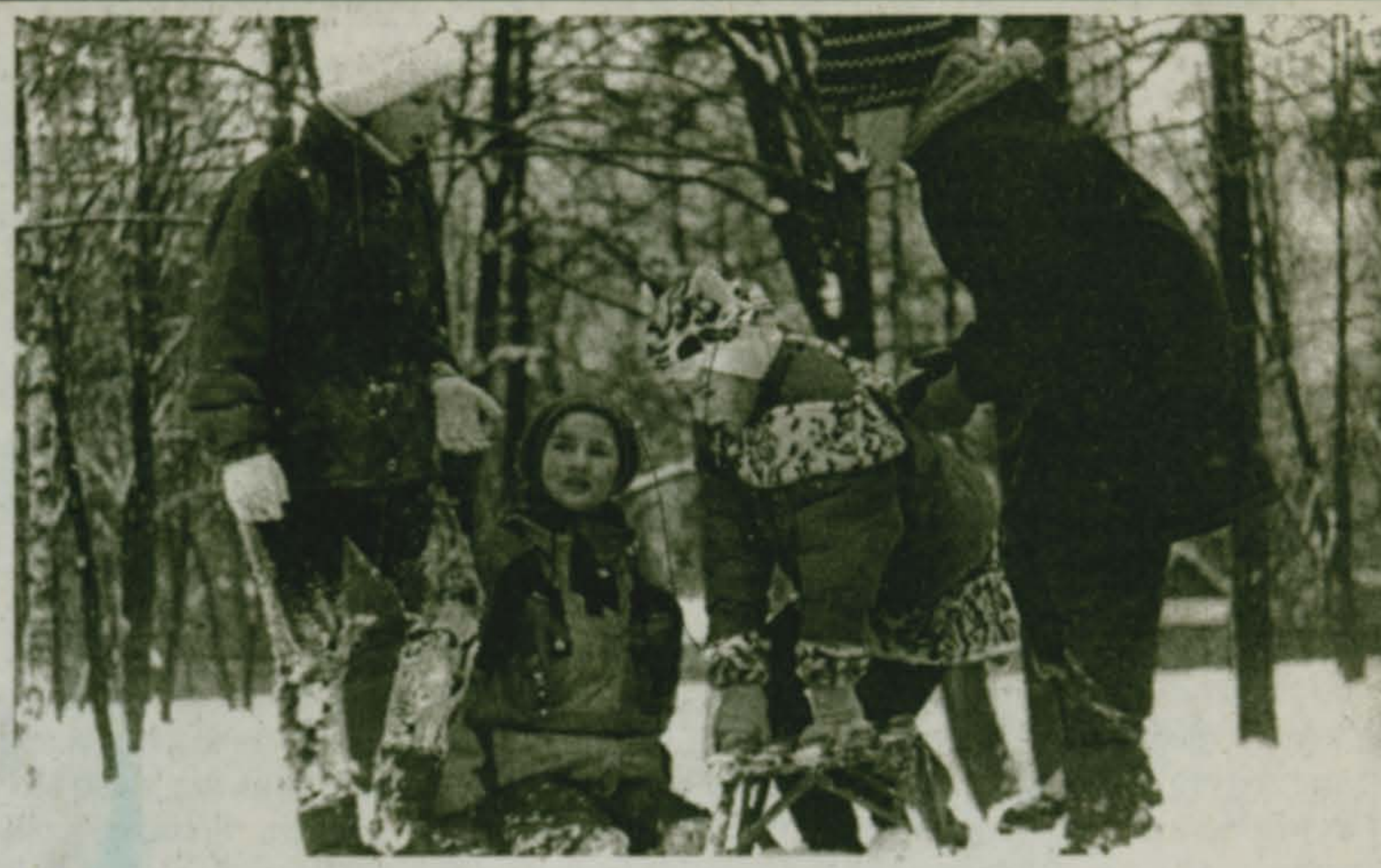
Зимние игры.