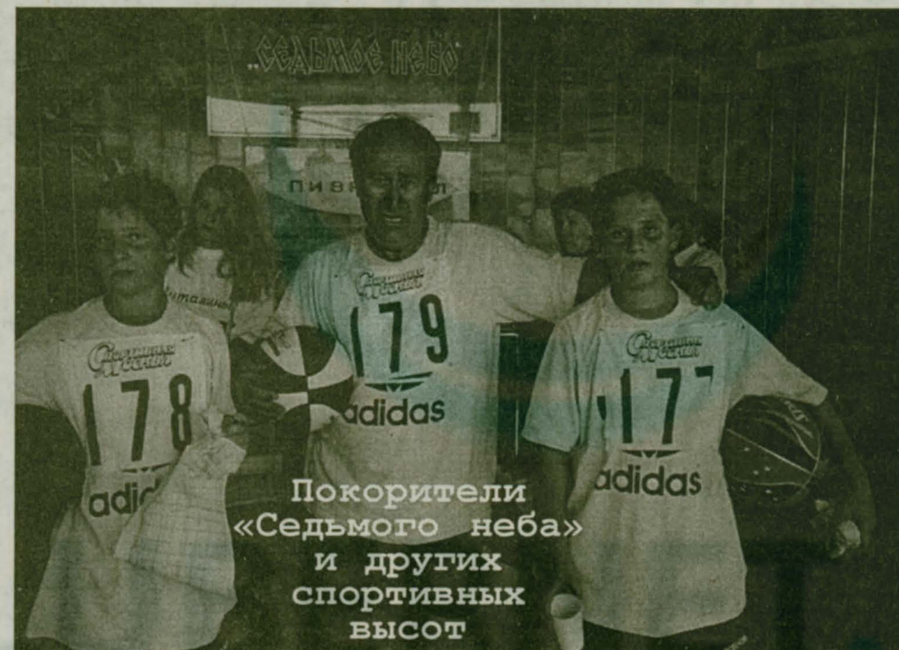
Покорители «Седьмого неба» и других спортивных высот