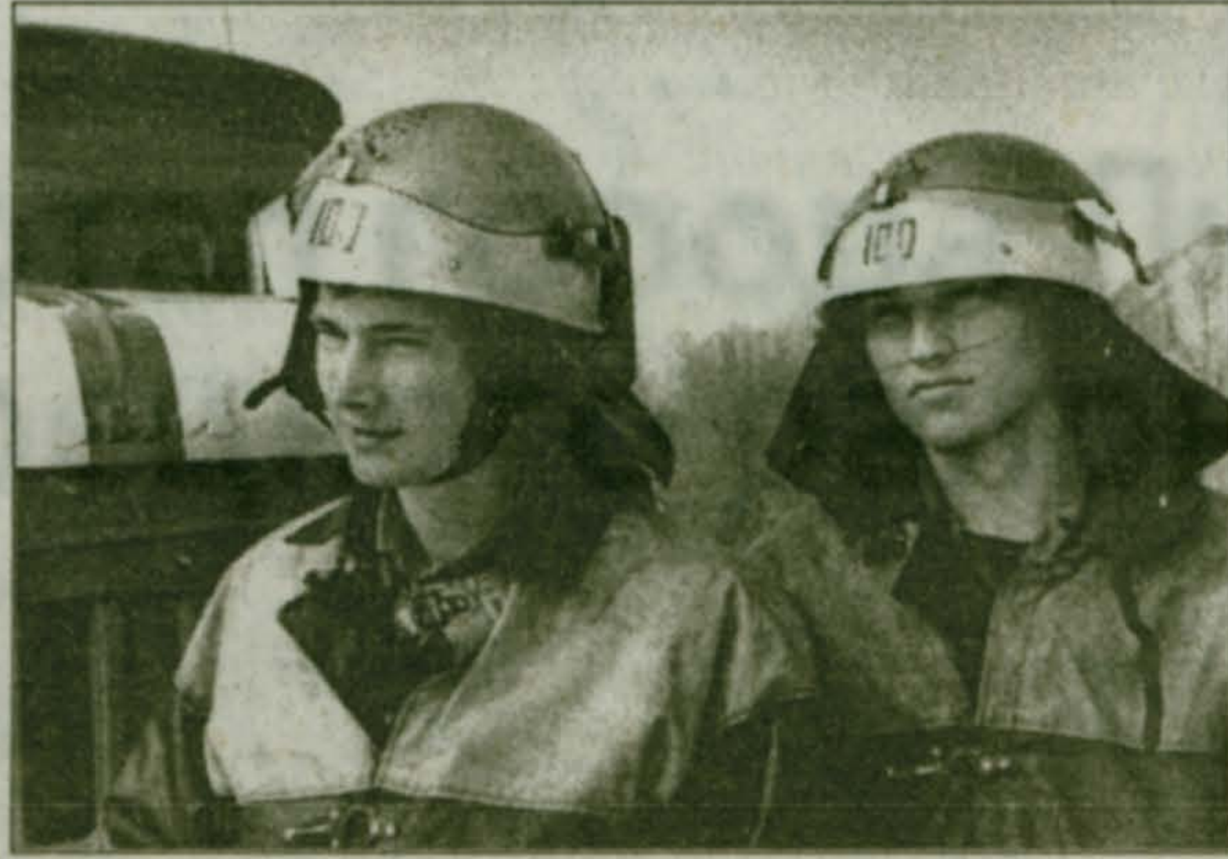
Фото и текст П. САЖИНА

Условный пожар был успешно потушен, условные пострадавшие «спасены» с крыши 5-этажного дома. За организацию и проведение Дня пожарной охраны в Малаховке отвечал инспектор Люберецкого ОГПС О.М. Сухов.