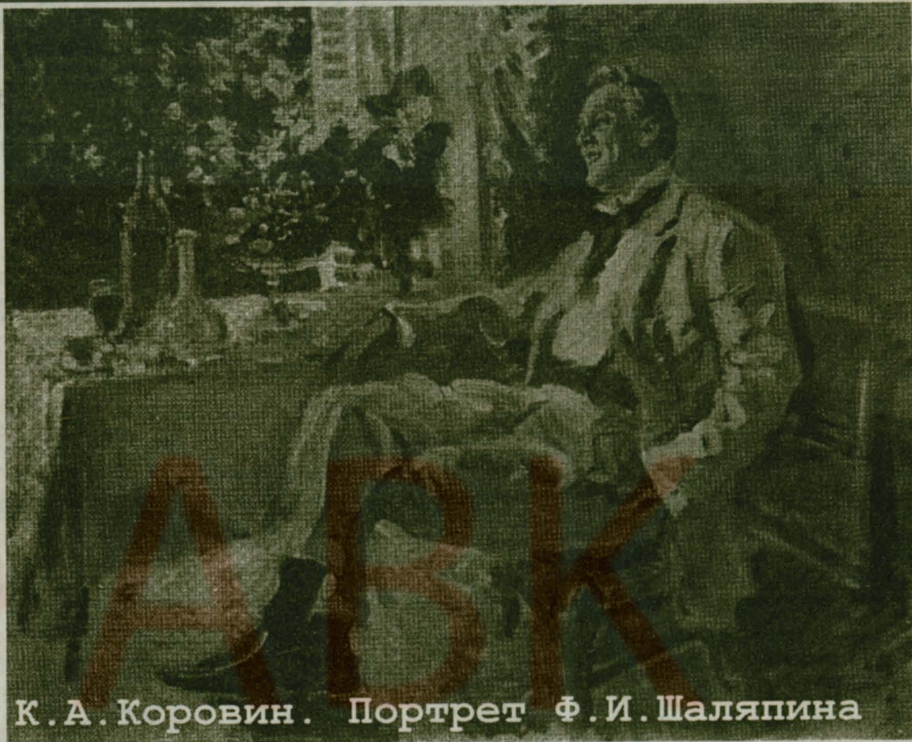
К.А.Коровин. Портрет Ф.И.Шаляпина

(К.А.Коровин. «Дурной сон». Публикация А.Вигилева.)