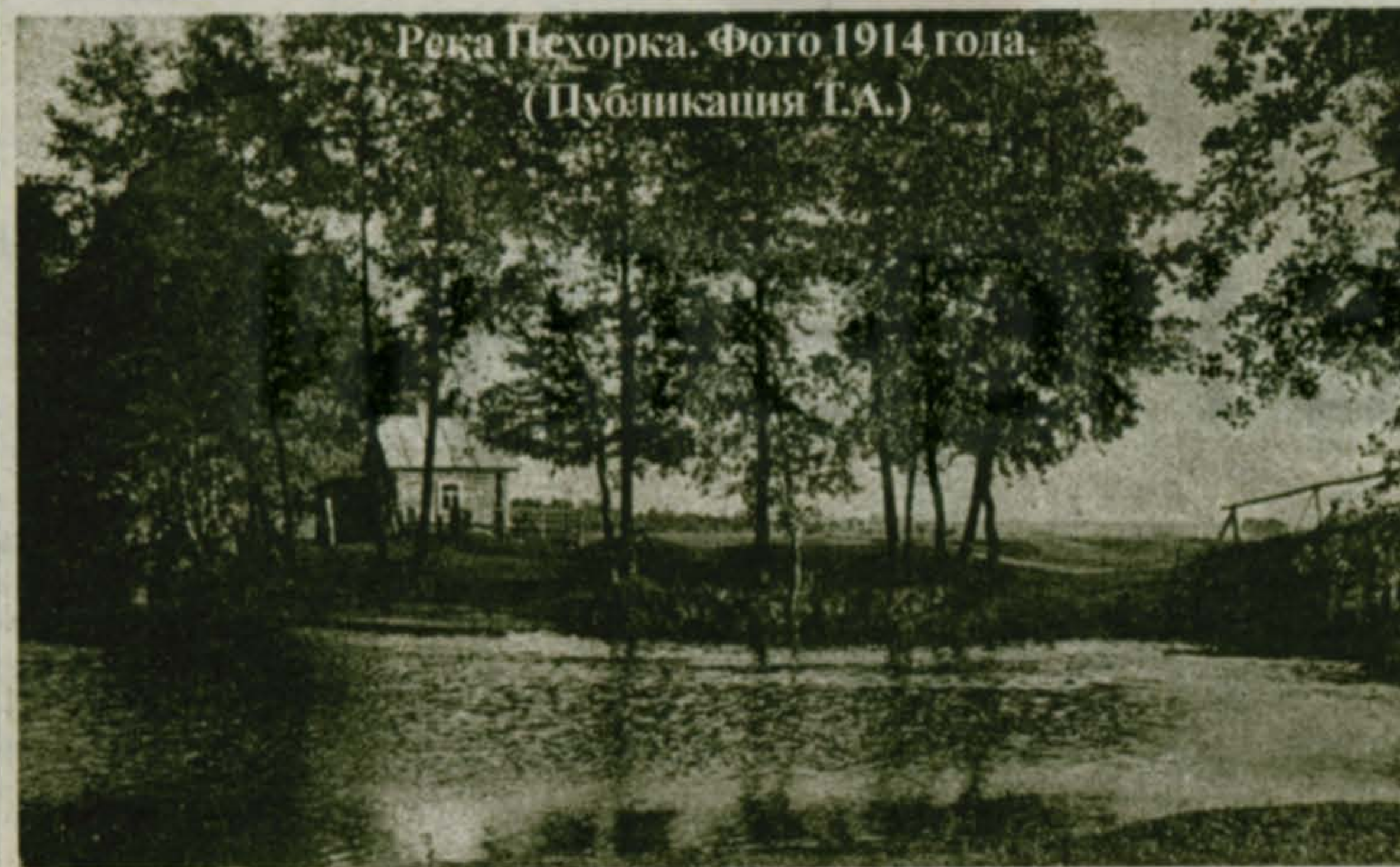
Река Пехорка. Фото 1914 года.

При получении ответов по почте учитывается дата на почтовом штампе - она должна быть не позже указанного числа. Желаем удачи!