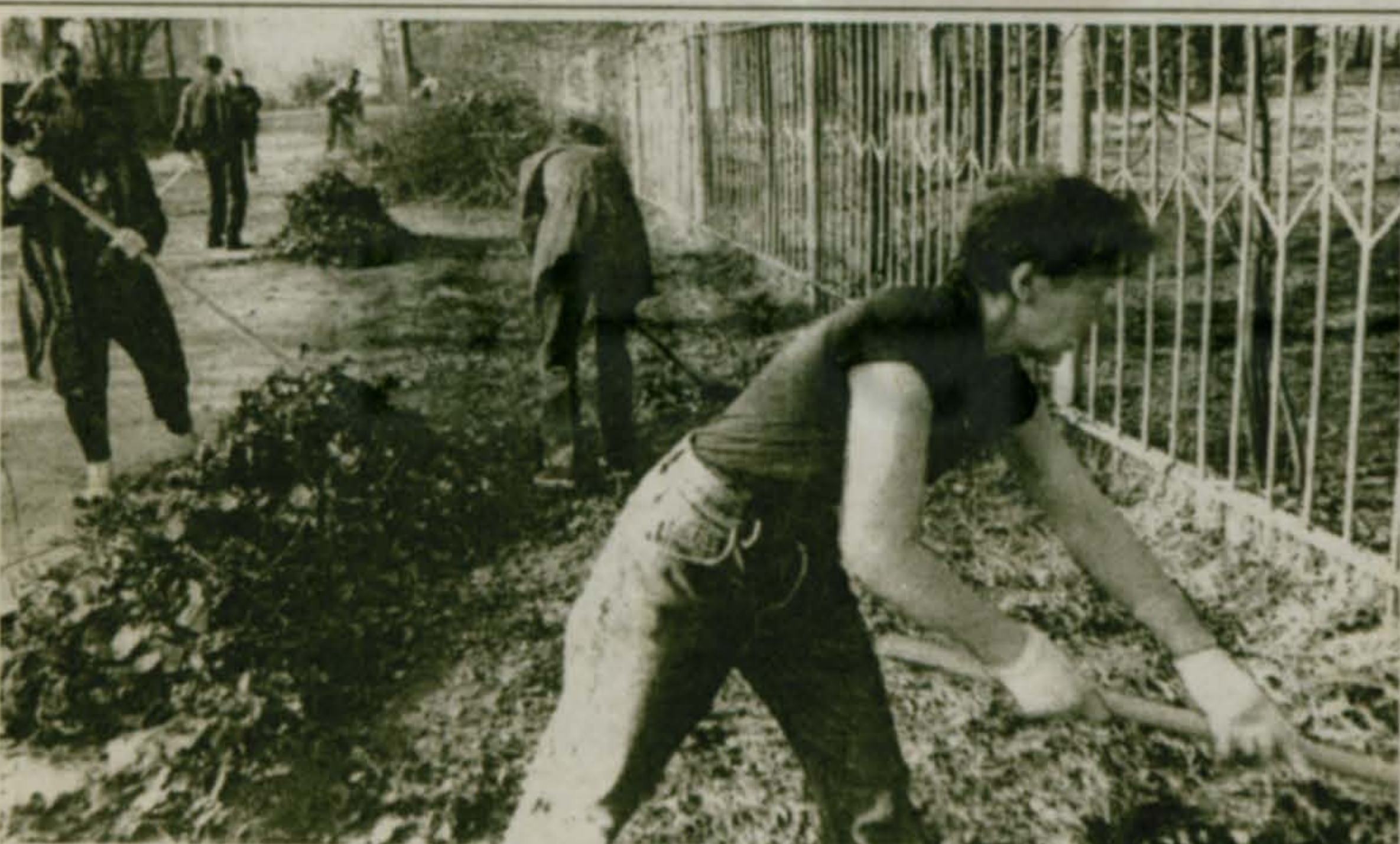
Работники поселковой администрации на субботнике в Летнем парке.