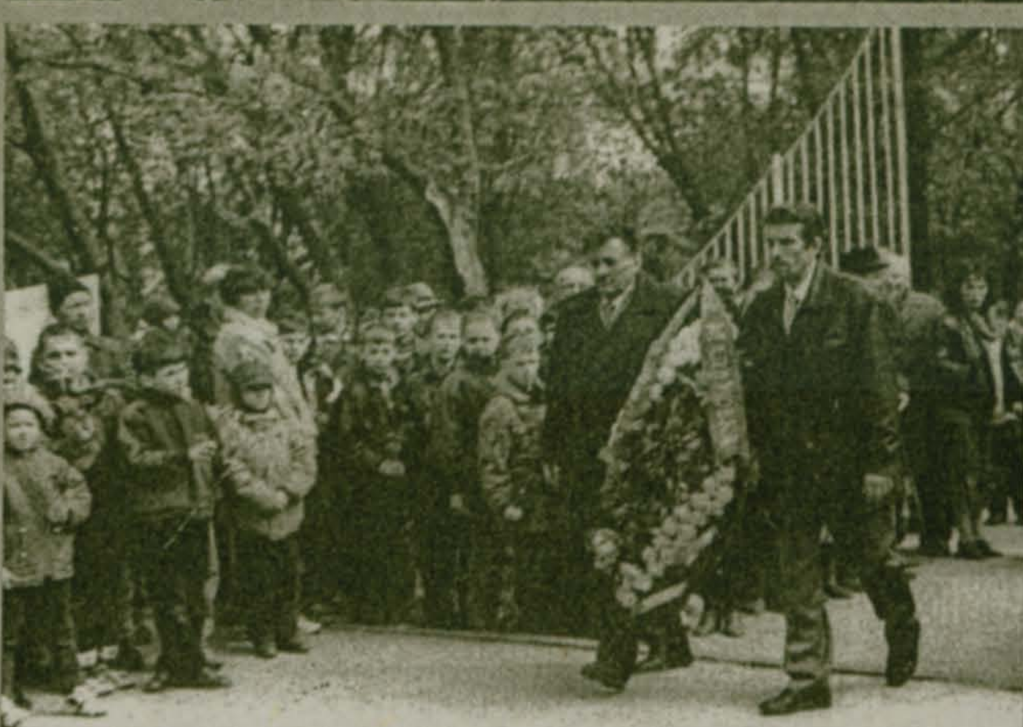
Фото и текст П. САЖИНА

Звучали песни и торжественная музыка, а в заключение прогремел воинский салют.