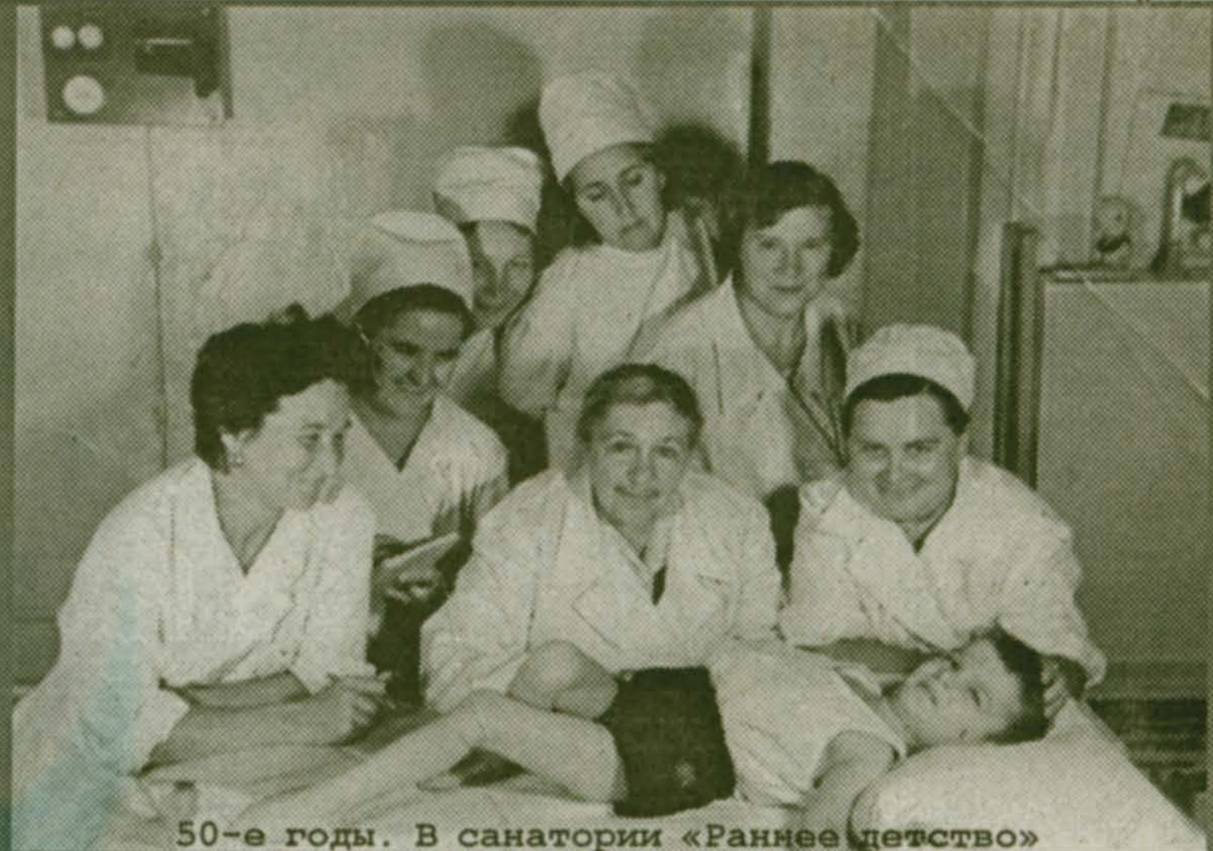
50-е годы. В санатории «Раннее детство»

Новых вам успехов на ниве борьбы за здоровье наших детей!