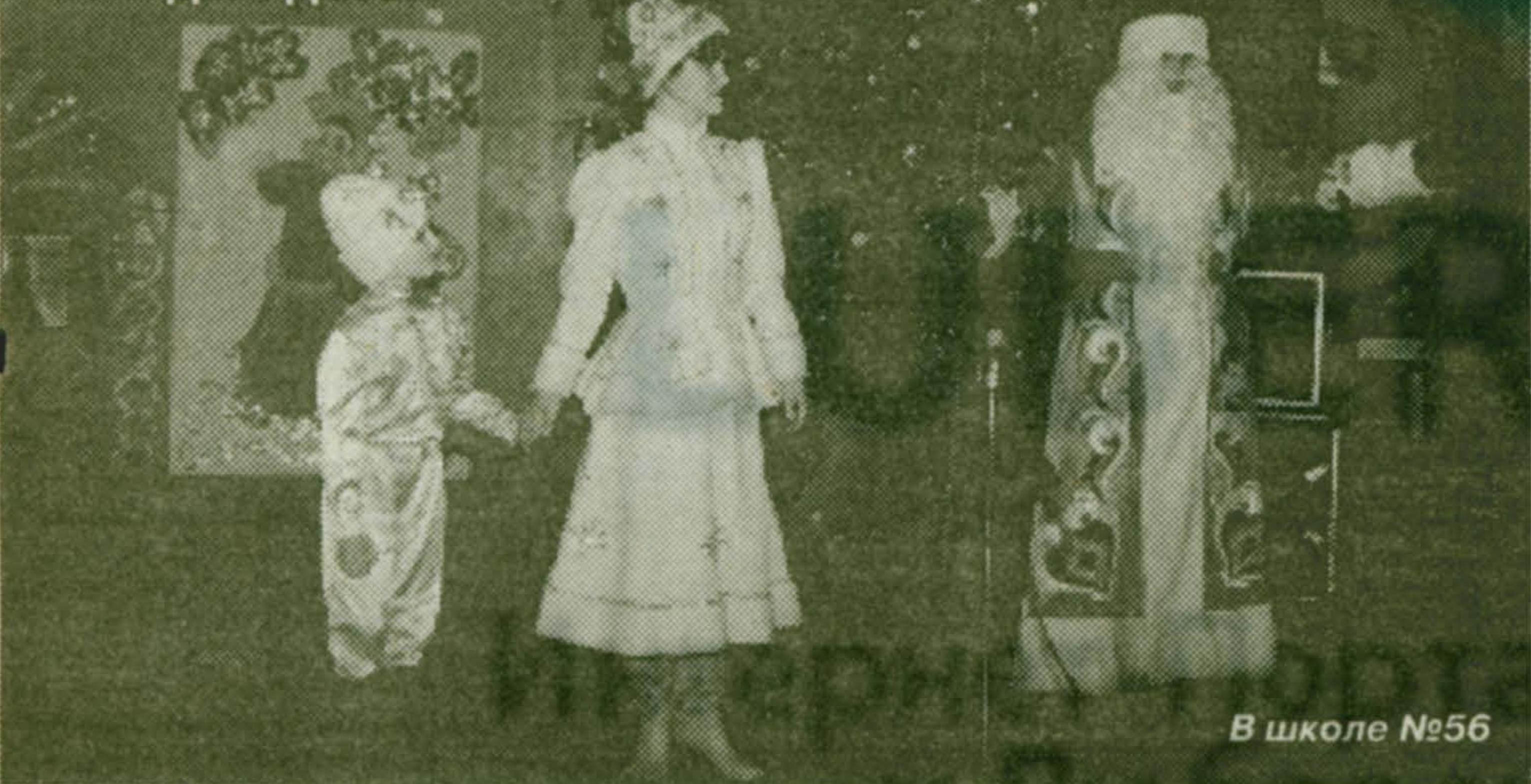
В школе №56