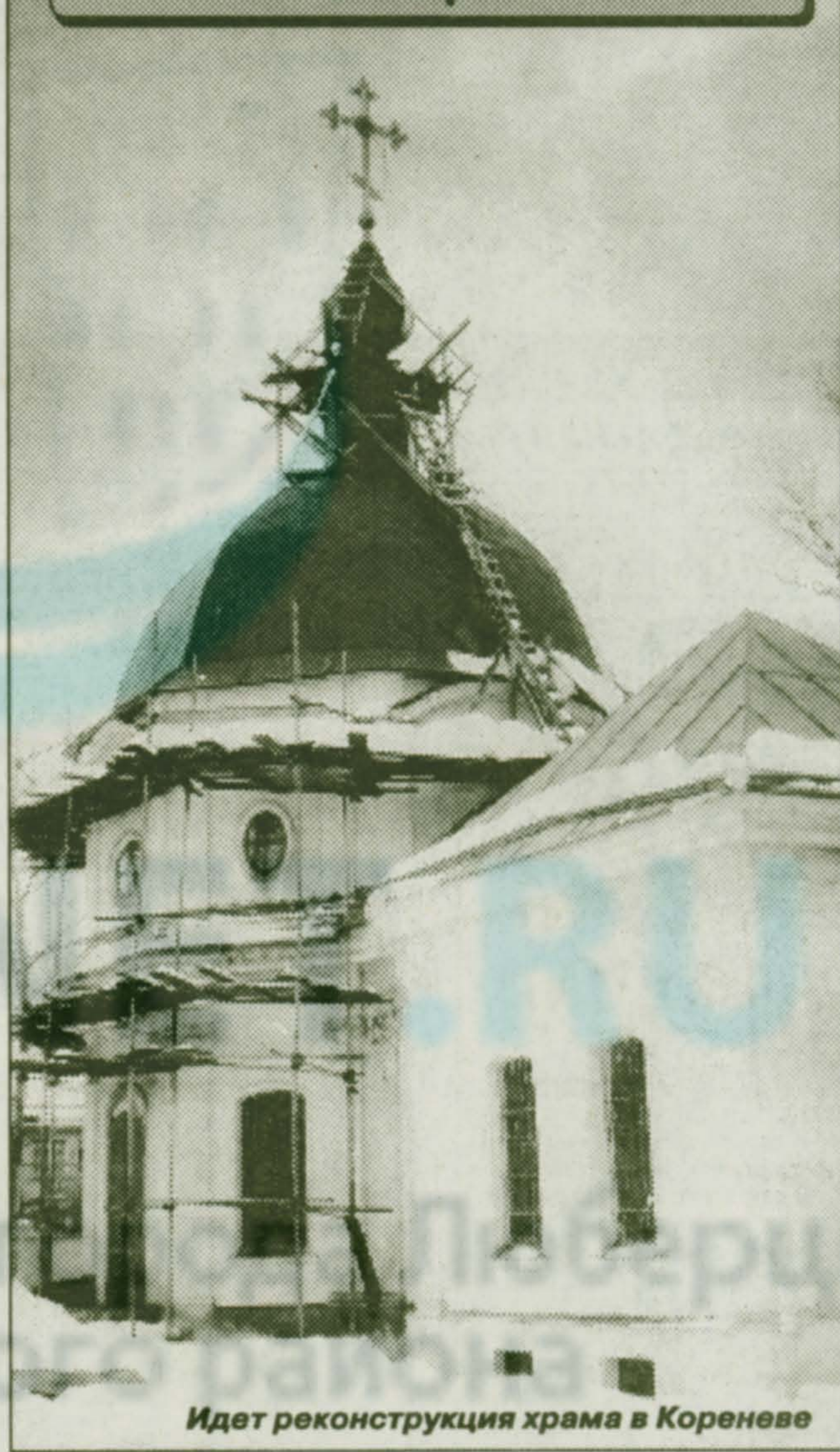
Идет реконструкция храма в Корневе